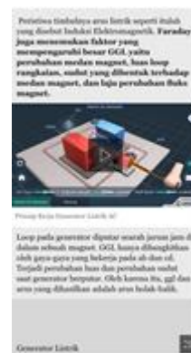
GAMBAR 6. Tampilan Materi pada E-Modul

Berdasarkan penelitian terdahulu didapatkan bahwa STEM dapat memfasilitasi keterampilan abad ke-21 yaitu berpikir kritis, kreatif, kolaborasi, dan komunikasi [10]. STEM dapat meningkatkan kemampuan siswa dalam berpikir secara kreatif saat menyelesaikan masalah dalam konsep fisika [11]. Proses pembelajaran yang berorientasi STEM harus dipelajari dan diterapkan secara bertahap di sekolah menengah untuk memenuhi perubahan reformasi Pendidikan [12]. Penelitian ini masih memerlukan penelitian lebih lanjut terkait validasi sehingga E-Modul layak digunakan dalam proses pembelajaran. Peneliti berharap e-modul yang dikembangkan dapat mejadi bahan belajar mandiri bagi peserta didik yang dapat dibuka kapanpun dan dimanapun. Semoga penelitian ini dapat