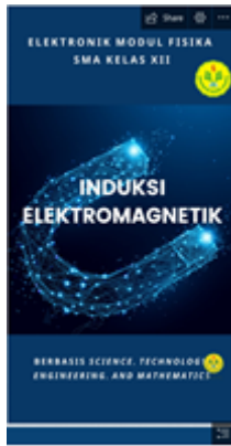
GAMBAR 1. Tampilan Sampul E-Modul

Berikut ini adalah tampilan desain E-Modul Berbasis Science, Technology, Engineering, and Mathematics (STEM) menggunakan Microsoft Sway pada Materi Induksi Elektromagnetik.