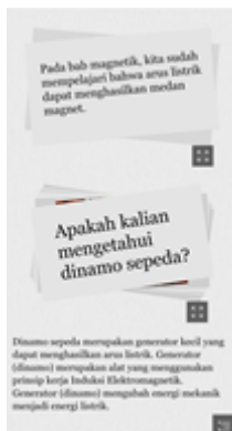
GAMBAR 5. Tampilan Materi pada E-Modul