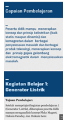
GAMBAR 4. Tampilan Capaian Pembelajaran