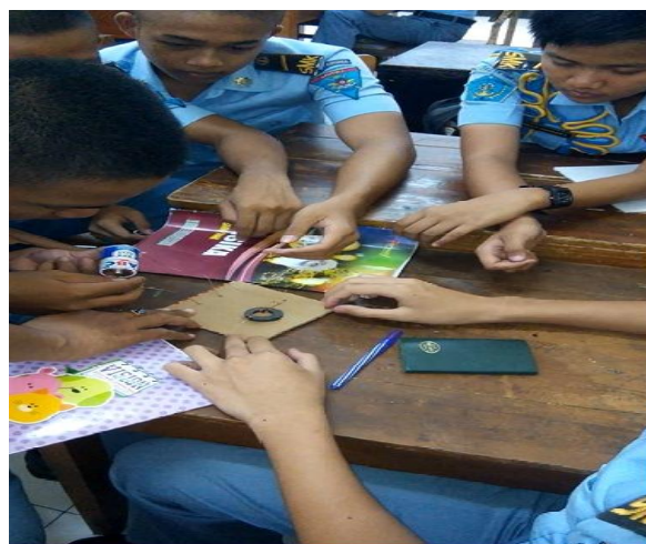
Gambar 2. Eksperimen siswa dengan pembuatan motor listrik sederhana

Melihat dari hasil pengamatan pembelajaran keaktifan siswa dalam mencari sumber bahan, kelancaran mengemukakan ide, kemampuan dalam menghimpun hasil diskusi, ketelitian dalam menghimpun hasil diskusi masuk kategori sudah cukup. Dan antusias siswa dalam mengikuti pelajaran, keaktifan dalam bertanya, keaktifan siswa dalam diskusi, kelancaran siswa dalam menjawab pertanyaan, keaktifan siswa dalam menuangkan ide-ide ke dalam tulisan, semangat dalam menampilkan hasil pekerjaan kelompok masuk kategori baik.