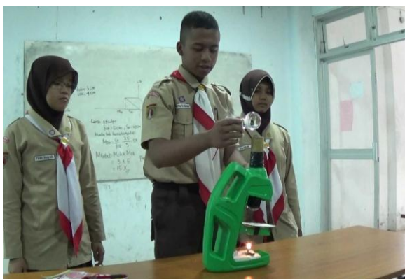
Gambar 2. Kegiatan Presentasi Mikroskop Sederhana dari Barang Bekas Secara Berkelompok

Sebelum pengerjaan proyek mikroskop sederhana dari barang bekas, siswa terlebih dahulu mempelajari struktur mikroskop di laboratorium uji mutu bahan makanan. Siswa mengamati secara detail cara kerja mikroskop dan membuat rancangan mikroskop yang akan di buat. Dengan rancangan produk ini daya imajinasi siswa kelas eksperimen lebih menonjol dibandingkan kegiatan membuat gambar sket pembentukan bayangan dari soal mikroskop yang dikerjakan siswa kelas kontrol. Rancangan yang dibuat siswa kelas eksperimen lebih nyata karena berupa rancangan sket produk dengan bahan barang bekas.