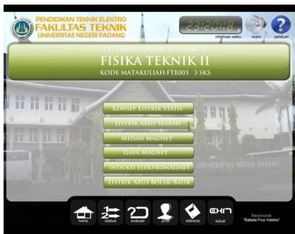
Gambar 2. Menu Home Media Interaktif

Efektivitas media interaktif dalam meningkatkan penguasaan konsep fisika mahasiswa ditinjau dari: (1) peningkatan penguasaan konsep fisika bagi mahasiswa kelas eksperimen, (2) perbedaan rata-rata skor penguasaan konsep fisika bagi mahasiswa kelas eksperimen dan kelas kontrol, (3) tanggapan mahasiswa terhadap pelaksanaan pembelajaran.