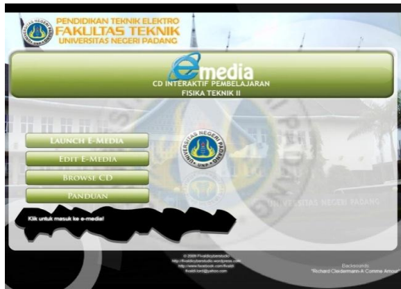
Gambar 1. Preload Media Interaktif

Media interaktif dibuat dengan software macromedia flash dikemas dalam bentuk compact disk (CD) yang dapat dijalankan secara otomatis, diawali dengan tampilan preload (Gambar 1) dilanjutkan sampai ke menu home (Gambar 2). Pada setiap materi disajikan kompetensi utama, uraian materi, evaluasi, dan referensi.