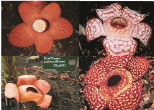
Gambar 1. Bunga Raflesia

dikombinasikan satin beludru. Tas yang dibuat menerapkan petite model kapasitas kecil untuk kegiatan berpergian dan beraktifitas.