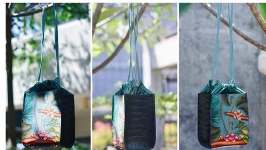
Gambar 5. Produk Tas 2

Nama Produk : The Arnoldii Crinkly-Handle Messenger Bag Jenis Produk : Messenger Bag Ukuran : L x W x H (23 cm x 7 cm x 17 cm) Bahan : Satin Bludru & Kulit (Produk Hewan) Sapi Warna : Dark Blue – Powder Blue Teknik : Digital Printing Textile Tahun : 2020