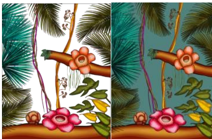
Gambar 3. Desain Gambar 2