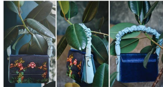
Gambar 4. Produk Tas 1

Dalam Penciptaan produk ini berupa tas fashion wanita yang terdiri dari 5 jenis diantaranya saddle bag , satchel bag , baguette bag , messenger bag dan bucket bag , memiliki motif 5 jenis rafflesia Indonesia diantaranya Rafflesia Arnoldii R.Br, Rafflesia Hasseltii, Rafflesia Patma dan Rafflesia Pricei dengan motif tumbuhan pendukung berupa inang rafflesia dari marga tetrastigma , byrophyta , cocos nucifera , areca palm , siwalan , anthurium , monstera , salam koja dan heliconia pada hutan hujan tropis.