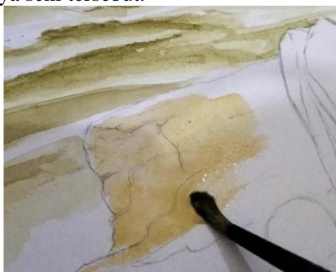
Gambar 4. Proses Perwarnaan

yang telah dibasahi untuk menciptakan efek gradasi dan perpaduan warna yang halus. Setelah latar belakang selesai, perhatian kemudian beralih ke pewarnaan objek-objek detail, di mana teknik pewarnaan lebih presisi dan fokus digunakan untuk menonjolkan elemen-elemen utama dalam karya seni tersebut.