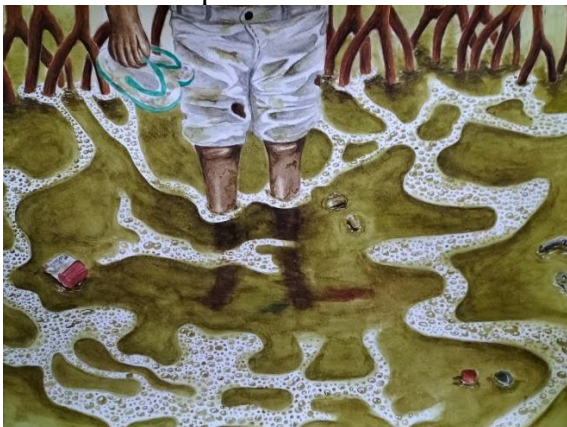
Gambar 8. Karya Final 3 (Buih Pencemar)

Karya tersebut merupakan karya yang dibuat diatas kertas berukuran 29,7 x 42,0 cm dengan menggunakan cat air. Karya tersebut dibuat pada tahun 2024.