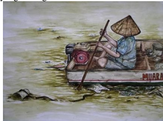
Gambar 10. Karya final 5 (Merengkuh Rezeki)

Karya dengan judul "Merengkuh rezeki" adalah sebuah ungkapan dalam bahasa Indonesia yang berarti mendekati atau meraih, yang berarti gambar lukisan diatas menggambarkan seorang nelayan yang sedang mencari rezeki.