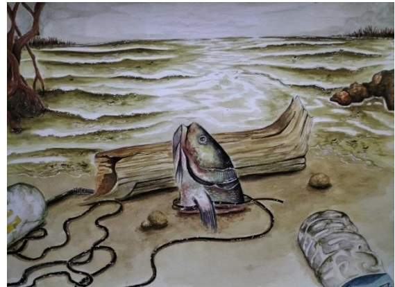
Gambar 7. Karya final 2 (Korban Limbah)

Karya ke-2 ini berjudul “Korban Limbah” merupakan karya yang dibuat diatas kertas berukuran 29,7 x 42,0 cm dengan menggunakan cat air. Karya tersebut dibuat pada tahun 2024. Terbelenggu oleh utas bermaksud ikan yang mati dikarenakan tercekik oleh limbah tali.