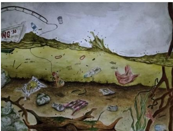
Gambar 11. Karya final 6 (Memancing Limbah) Sumber: Dafa Lutfiana, 2024

Lukisan ke-6 menggambarkan kondisi lingkungan perairan yang sangat tercemar oleh sampah.