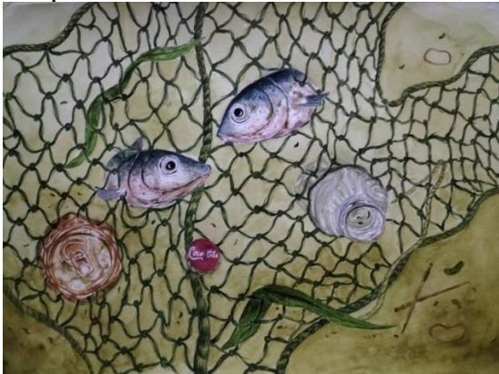
Gambar 12. Karya final 7 (Perangkap Polusi)

Pada karya 7 menggambarkan dua ikan yang terperangkap dalam jaring dengan beberapa limbah yang terjebak dalam jaring tersebut, termasuk kaleng minuman dan tutup botol coca-cola. Dengan latar belakang air yang keruh tercemar yang ditandai dengan adanya kaleng, dan tutup botol yang mencerminkan pencemaran laut oleh sampah manusia.