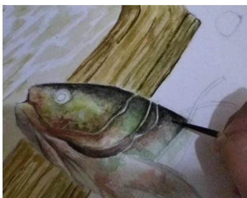
Gambar 5. Proses Detail Karya

Setelah lapisan awal cat air mengering, perupa melanjutkan proses pewarnaan dengan menambahkan lapisan-lapisan berikutnya hingga mencapai tingkat detail dan realisme yang diinginkan. Pada tahap ini, teknik "wet on dry" sering digunakan untuk pembuatan detail karya, karena memungkinkan kontrol yang lebih tinggi dalam penerapan warna dan garis, sehingga hasilnya lebih presisi dan terdefinisi dengan baik.