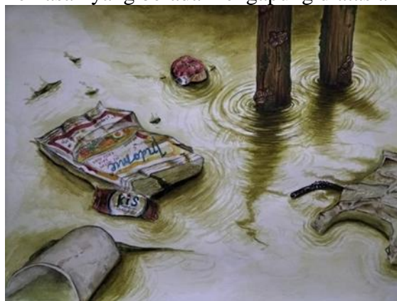
Gambar 9. Karya final 4 (Tak Terurai)

Karya final 4 ini berjudul "Tak Terurai" merupakan karya yang dibuat diatas kertas berukuran 29.7 x 42.0 cm atau A3 menggunakan cat air. Karya tersebut dibuat pada tahun 2024. Seleraku disini dimaksudkan kepada sampah plastik yang sulit dan butuh waktu lama untuk terurai sebagai objek bungkus mie indomie kemasan yang berada mengapung diatas air.