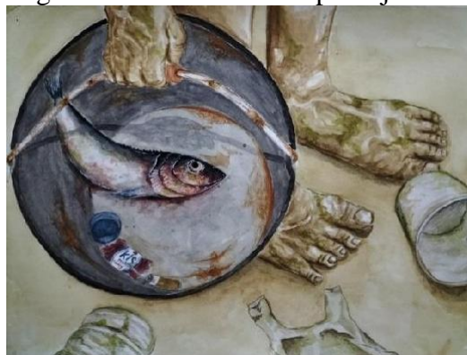
Gambar 6. Karya Final 1 (Seekor Hasil Laut)

Karya ke-1 ini berjudul "Seekor Hasil Laut" merupakan karya yang dibuat di atas kertas berukuran 29,7 x 42,0 cm dengan menggunakan cat air. Karya tersebut dibuat pada tahun 2024. Lukisan ini memperlihatkan seseorang nelayan yang pulang membawa hasil tangkapan yang hanya satu. Di sekitar kakinya terdapat berbagai jenis sampah seperti botol plastik dan gelas bekas minuman cepat saji.