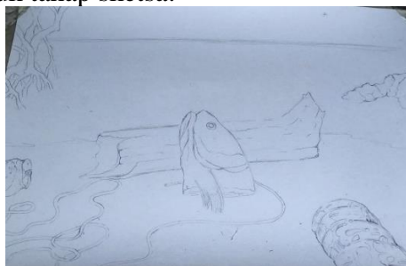
Gambar 1. Sketsa Karya 1

Tahap pelaksanaan diawali dengan membuat sketsa yang harus melalui proses bimbingan dengan dosen pembimbing dan melalui pencarian inspirasi. Berikut beberapa hasil untuk tahap sketsa untuk hasil untuk tahap sketsa: