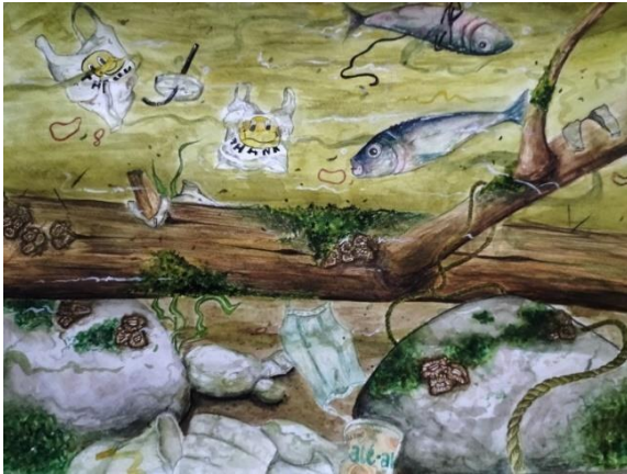
Gambar 12. Karya final 8 (Bermukim Diantara Limbah)