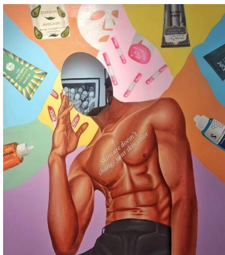
Gambar 2. "You Can Be Masculine Without Being Toxic"

Karya kedua berjudul "You Can Be Masculine Without Being Toxic" yang artinya kamu bisa terlihat maskulin tanpa harus menjelekan laki-laki yang menggunakan skincare (toxic/beracun). Skincare selalu diidentikan dengan warna, beberapa orang masih banyak yang berkiblat untuk satu fisik yang baik berasal dari barat atau korea karena kulit mereka yang sehat berwarna putih. Namun berbeda dengan pandangan perupa, perupa berpandangan bahwa kulit yang sehat adalah kulit yang bersih. terlepas dari hal yang rasis bukan berarti menggunakan skincare pada kulit orang yang hitam akan merubah warna kulit tersebut.