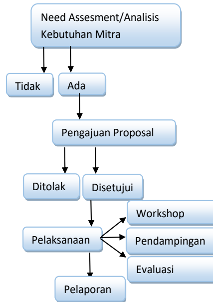
Gambar 1. Tahapan Pelaksanaan kegiatan pengabdian

Tahapan awal kegiatan pengabdian ini akan dijelaskan melalui bagan berikut: