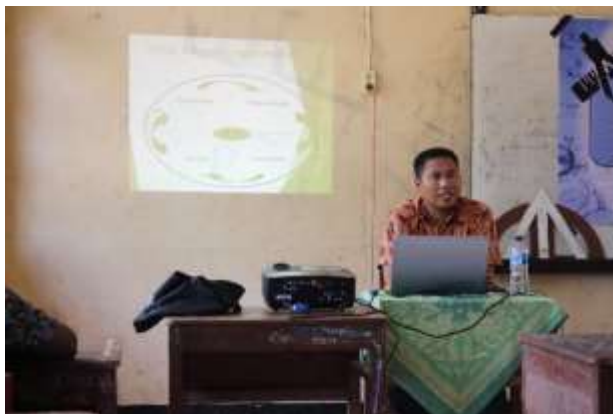
Gambar 2. Presentasi materi workshop

mengembangkan media pembelajaran dengan sumber daya yang terbatas.