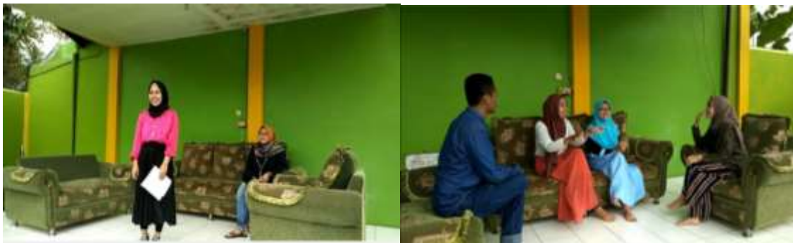
Gambar 2. Melatih teknik monolog dan dialog