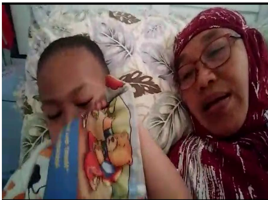
Gambar 4. Video Unggahan Peserta TN Menampilkan Bonding Antara Orang Tua Dan Anak

Pada video terlihat buku tersebut terkadang diambil oleh audien dan digigit. Hal ini sebenarnya sangat wajar karena membacakan buku pada prinsipnya merupakan kegiatan yang menyenangkan bagi anak. TN sudah berhasil dengan tenang membiarkan anak mengeksplorasi buku tersebut.