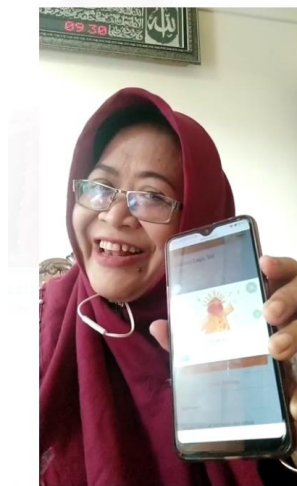
Gambar 5. Video Unggahan Peserta NN Menggunakan HP sebagai Buku

Gambar di atas merupakan cuplikan video Ibu NN sedang membacakan buku cerita berjudul Datang Lagi, Ya . Berdasarkan video yang juga diunggah pada laman youtube NN menerapkan pembacaan buku dari aplikasi menggunakan HP. NN sangat interaktif sejak awal dengan menanyakan kepada anak-anak seputar pengetahuan latar tentang Ondel-ondel.