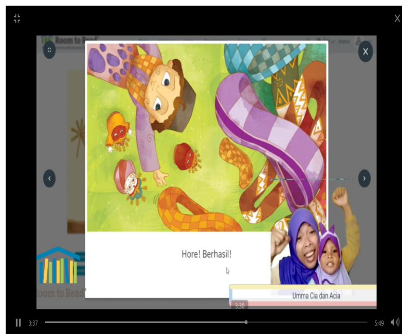
Gambar 2. Video Unggahan Peserta KR Menggunakan Gesture Dan Ekspresi

Pada video tersebut, ia menggunakan buku cerita berjudul Datang Lagi, Ya! dengan menggunakan media zoom untuk menampilkan buku dan merekam. Pada pembacaan nyaring ini, ia memiliki seorang audiens yaitu putrinya yang berusia 2 tahun.