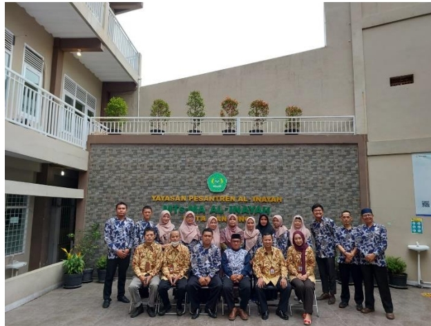
Gambar 3. Peserta Pelatihan

Pelatihan dihadiri oleh 15 orang peserta yang merupakan pengurus Koperasi Madrasah Aliyah Al-Inayah seperti gambar berikut.