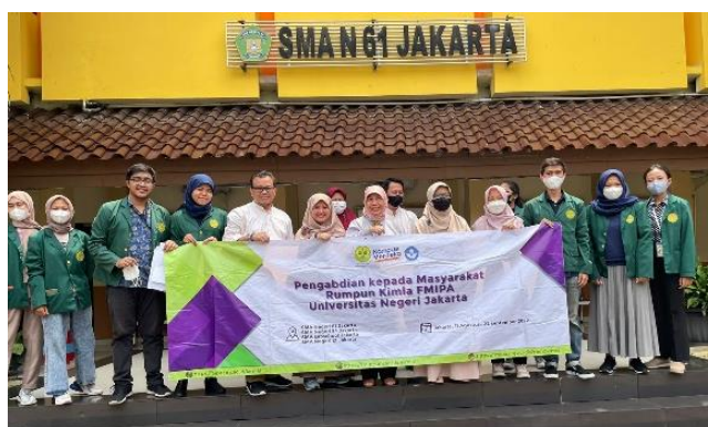
Gambar 8. Dokumentasi Tim Pelaksana dengan Panitia Kimia UNJ di SMAN 61 Jakarta