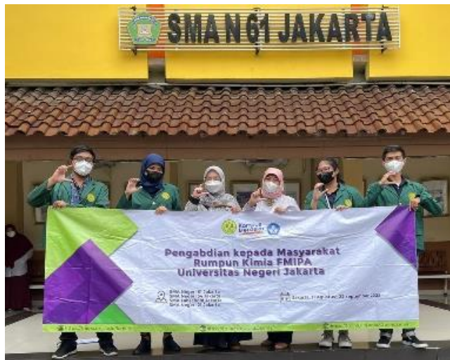
Gambar 7.

bukti fisik pelaksanaan kegiatan. Foto pada sesi penutupan dengan tim pelaksana disajikan pada gambar 7 dan 8.