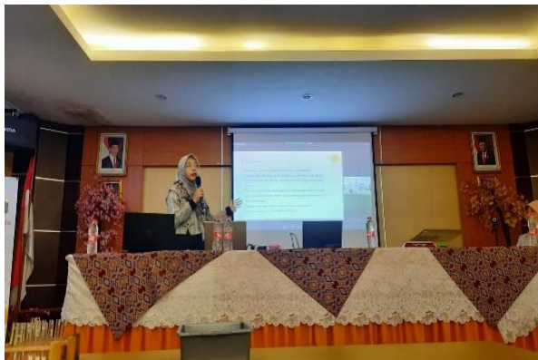
Gambar 3. Penyampaian Materi Pengembangan E-Modul sebagai Media Pembelajaran oleh Alumni (Nazrisya Hairishah)

Pelaksanaan P2M yang dilakukan bersama Tim dan Guru-guru Kimia MGMP Jakarta Timur wilayah 1 berjalan dengan lancar. Beberapa peserta ikut berkontribusi dalam pelaksanaan praktikum yang di lakukan. Sebagian besar peserta sangat antusias mengikuti dan mengamati praktikum uji kualitatif asam amino dan protein menggunakan bahan-bahan yang ada disekitar rumah, ramah lingkungan, dan dapat diterapkan dengan konsep green chemistry . Tim Mahasiswa sangat aktif untuk berdiskusi dan menjawab berbagai pertanyaan tentang konsep pengendapan protein, koagulasi, dan pengaruh asam, basa dan suasana netral pada proses koagulasi. Keterbatasan waktu yang tersedia