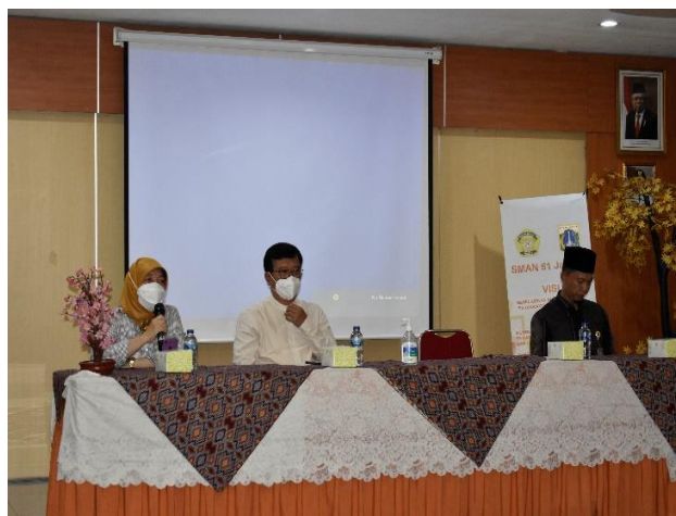
Gambar 1. Arahan Ketua LPPM UNJ, Dekan FMIPA, dan Ketua MGMP Kimia Wilayah I Jakarta Timur pada Pelaksanaan P2M Tim Kimia UNJ