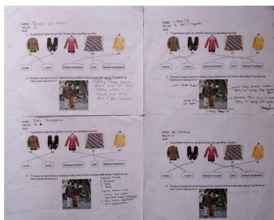
Gambar 5. Posttest Peserta Pelatihan untuk Mengukur Pemahaman tentang Busana Jawa Gagrag Ngayogyakarta