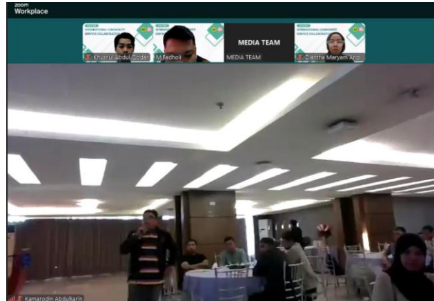
Gambar 1. Ruang Hybrid Pelaksanaan kegiatan Kolaborasi Indonesia-Filipina untuk Mendorong Pengajaran Kreatif di Zamboanga

sejawat dalam memecahkan masalah pengajaran.