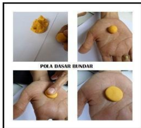
Gambar 3. Clay pola tetes air