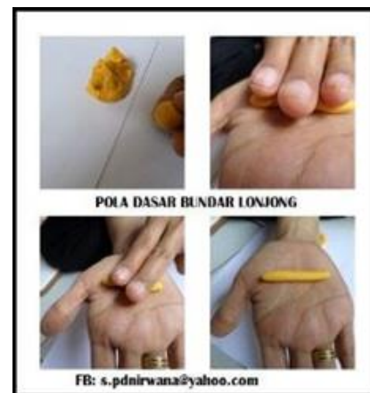
Gambar 4. Clay pola daun