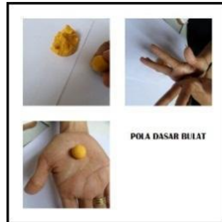
Gambar 2. Clay pola bundar