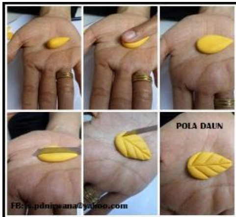
Gambar 1. Clay pola bulat