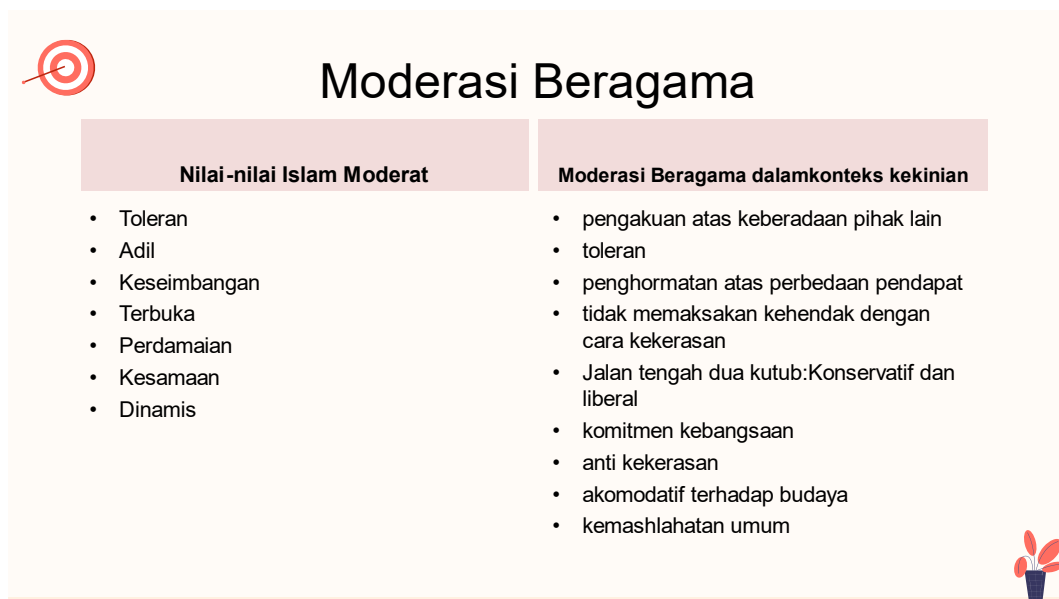
Gambar 3. Materi Prinsip- prinsip Moderasi Beragama

Adapun materi pokok yang disampaikan nara sumber menekankan pada penguatan berjalannya fungsi fasilitator Da'i dalam menyampaikan dan mensosialisasikan pemahaman dan sikap moderasi beragama pada jamaah pengajian. Visi moderat dalam berfikir dan bersikap bagi Da'i tidak lain bagian dari profesionalisme dalam berdakwah, karena Da'i harus memiliki sifat kasih sayang (Suhardi, 2024; Zain, 2019), sebagaimana cara berdakwah yang diajarkan dalam Alquran (Arina Alfiani et al., 2023). Kegiatan yang diselenggarakan dan sangat relevan dengan kebutuhan para Da'i saat ini yang sangat mungkin terpapar oleh paham-paham kaku yang mengarah pada ekstrimisme dan mudah menyalahkan pihak lain sesama muslim atau di luar muslim. Secara terstruktur sub materi tersebut dibahas secara sistematis dengan metode ceramah interaktif. Di sela-sela penyampaian materi, nara sumber mengajukan pertanyaan atau meminta tanggapan dari peserta tentang isu yang dibahas. Metode interaktif ini dilakukan dalam rangka menumbuhkan sikap kesetaraan dan keterbukaan antara nara sumber dan peserta.