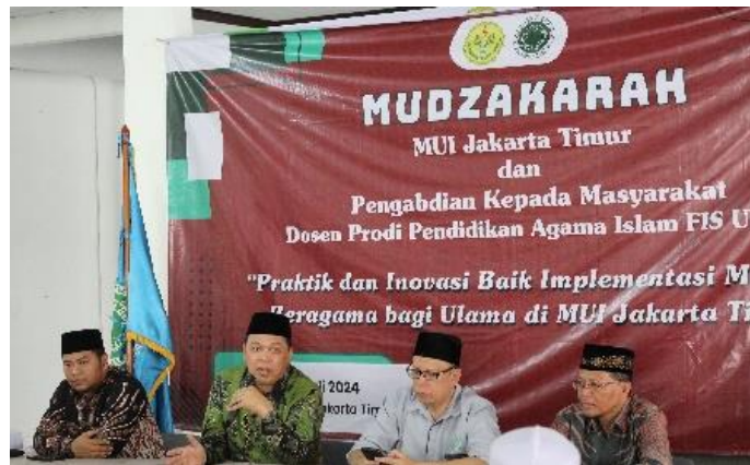
Gambar 1 Sambutan Ketua MUI Jakarta Timur