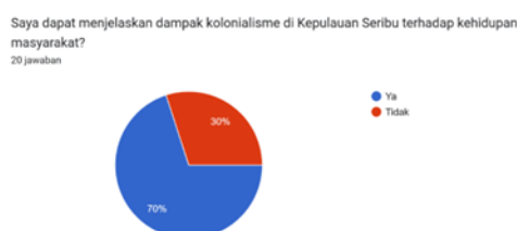
Grafik Hasil Angket Pemahaman Materi (4)