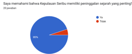
Grafik Hasil Angket Pemahaman Materi (1)

Hasil angket menunjukkan bahwa 95% siswa memahami bahwa Kepulauan Seribu menyimpan peninggalan sejarah yang penting. Seluruh responden (100%) dapat menyebutkan contoh peninggalan sejarah di Pulau Onrust serta mengaitkan sejarah lokal dengan sejarah nasional.