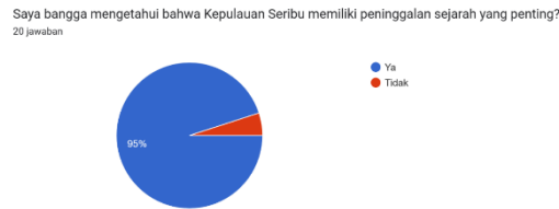
Grafik Hasil Angket Sikap Nilai Keindonesiaan (1)

Sebanyak 95% siswa menyatakan bangga terhadap peninggalan sejarah di Kepulauan Seribu dan merasa terdorong menjaga kelestariannya.