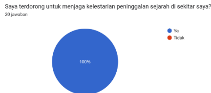
Grafik Hasil Angket Sikap Nilai Keindonesiaan (2)

Mereka juga mengaku pembelajaran ini menumbuhkan rasa cinta tanah air dan meningkatkan kesadaran akan pentingnya persatuan bangsa. Temuan ini memperlihatkan bahwa sejarah lokal tidak hanya berdampak pada ranah kognitif, tetapi juga afektif. Hasil ini konsisten dengan Firmansyah, dkk yang menemukan bahwa pendidikan sejarah berbasis lingkungan lokal dapat memperkuat rasa identitas dan kesadaran kebangsaan siswa (Firmansyah, Silahudin, Ikramullah, & Kamariah, 2022). Dengan demikian, hipotesis penelitian terbukti: integrasi sejarah lokal efektif membentuk karakter keindonesiaan sekaligus memperkuat nasionalisme siswa.