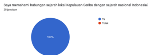
Grafik Hasil Angket Pemahaman Materi (3)

Akan tetapi, hanya 70% yang mampu menjelaskan dampak kolonialisme terhadap kehidupan masyarakat setempat.