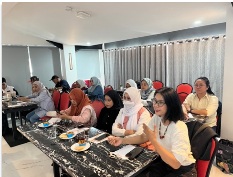
Gambar 4. Peserta Pelatihan Jurnalistik untuk Blogger Bandung

Dari hasil yang diperoleh tim, pemaparan materi berlangsung dengan baik. Antusiasme peserta terlihat dari jalannya FGD dan bentuk-bentuk pertanyaan yang diajukan setelahnya. Kegiatan pengabdian ini memberikan banyak masukan, pemahaman dan berbagai tindakan pencegahan mengenai berbagai masalah yang biasa muncul akibat kurangnya pemahaman mengenai kaidah penulisan jurnalistik. Sehingga adanya bekal pengetahuan yang berkaitan dengan elemen jurnalisme dapat membuat pegiat media blogger menerapkan elemen itu dalam setiap aktivitas kepenulisannya.