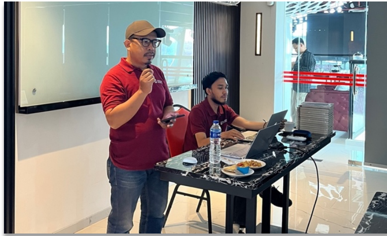
Gambar 2. Penyampaian Materi Dasar Jurnalistik untuk Blogger Bandung

Setelah materi pertama disampaikan, dilakukan juga pemaparan materi kedua yang berlangsung selama 30 menit. Pemaparan materi ini adalah lanjutan dari materi pertama sebelumnya yang berkaitan dengan elemen jurnalisme Kovach & Rosenstiel (2014). Dalam buku The Elements of Journalism: What Newspeople Should Know and the Public Should Expect , Kovach & Rosenstiel (2014) merumuskan sembilan elemen jurnalisme. Namun, mereka melakukan pembaruan khusus dengan menambahkan satu elemen tambahan, yakni jurnalisme warga, sehingga dengan pertimbangan kebaruan itu, tim memberikan mitra pemahaman dengan fokus pada kesepuluh elemen jurnalisme tersebut. Kajian ilmiah buku itu yang menjadi landasan oleh tim untuk mengadakan workshop jurnalistik ini.