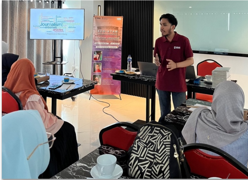
Gambar 3. Penyampaian materi literasi Jurnalisme dan konteks blogger

Selain itu, penulis blogger juga harus mengetahui bahwa loyalitasnya harus difokuskan pada masyarakat dan pembacanya. Ini yang menjadi elemen jurnalistik yang kedua. Materi ini menekankan pada pemahaman bahwa penulis blog harus mampu mendahulukan kepentingan masyarakat daripada mementingkan bisnisnya sendiri. Hal ini penting, mengingat Adolps Ochs dan Eugene Meyer, pebisnis media Amerika Serikat, pernah membuktikannya. Ketika prinsip loyalitas media diarahkan pada pembaca dan masyarakat, media yang mereka kembangkan menjadi institusi publik yang prestisius sekaligus bisnis yang menguntungkan. Dalam hal ini, Komunitas Blogger Bandung dituntut agar mampu mengarahkan loyalitasnya pada pembacanya.