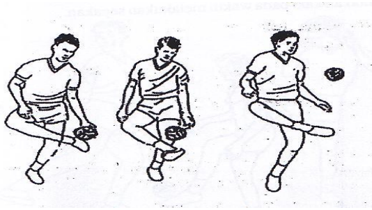
Gambar 1. Teknik Melakukan Sepak Sila

Teknik-teknik melakukan sepak sila (Sofyan Hanif, 2015) adalah;