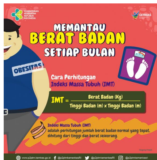
Gambar 1. Memantau Berat Badan

Penggunaan rumus ini hanya dapat diterapkan pada seseorang berusia antara 19 hingga 70 tahun, berstruktur tulang belakang normal, bukan atlet atau binaragawan, dan bukan ibu hamil atau menyusui. Pengukuran IMT ini dapat digunakan terutama jika pengukuran tebal lipatan kulit tidak dapat dilakukan atau nilai bakunya tidak tersedia (Gibson, 2005). Interpretasi IMT pada anak tidak sama dengan IMT pada orang dewasa. IMT pada anak disesuaikan dengan umur dan jenis kelamin anak, karena anak lelaki dan perempuan memiliki kadar lemak tubuh yang berbeda.