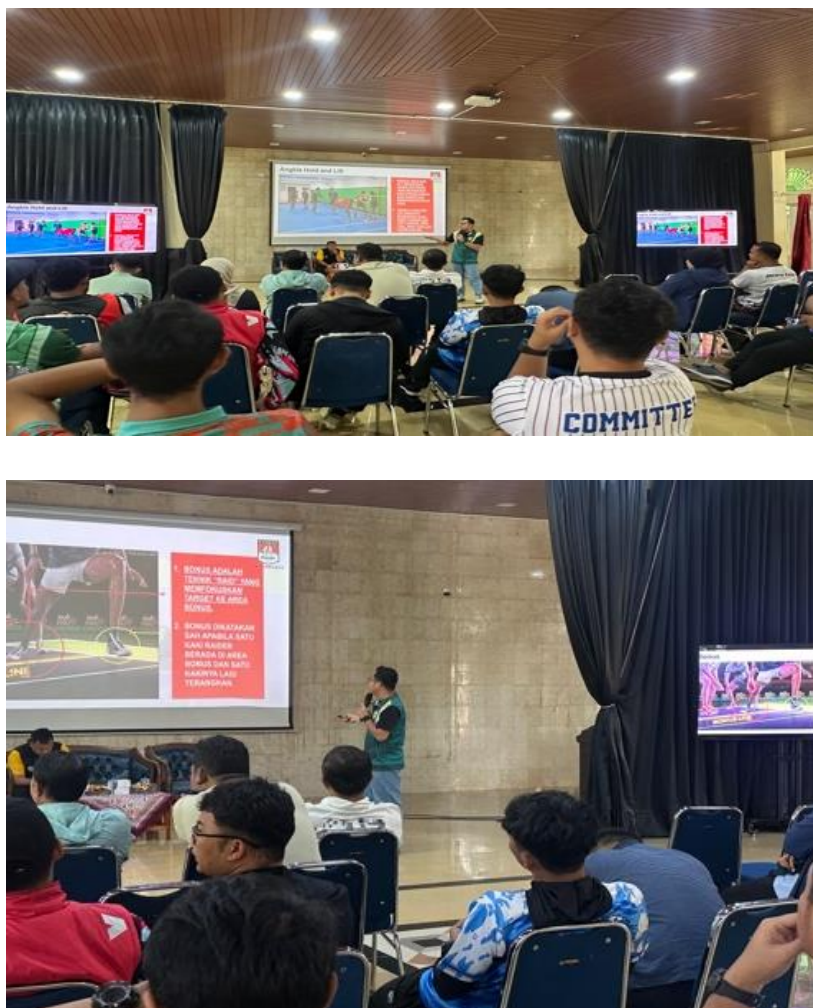
Gambar 2. Dokumentasi Pelaksanaan Pengabdian Kepada Masyarakat