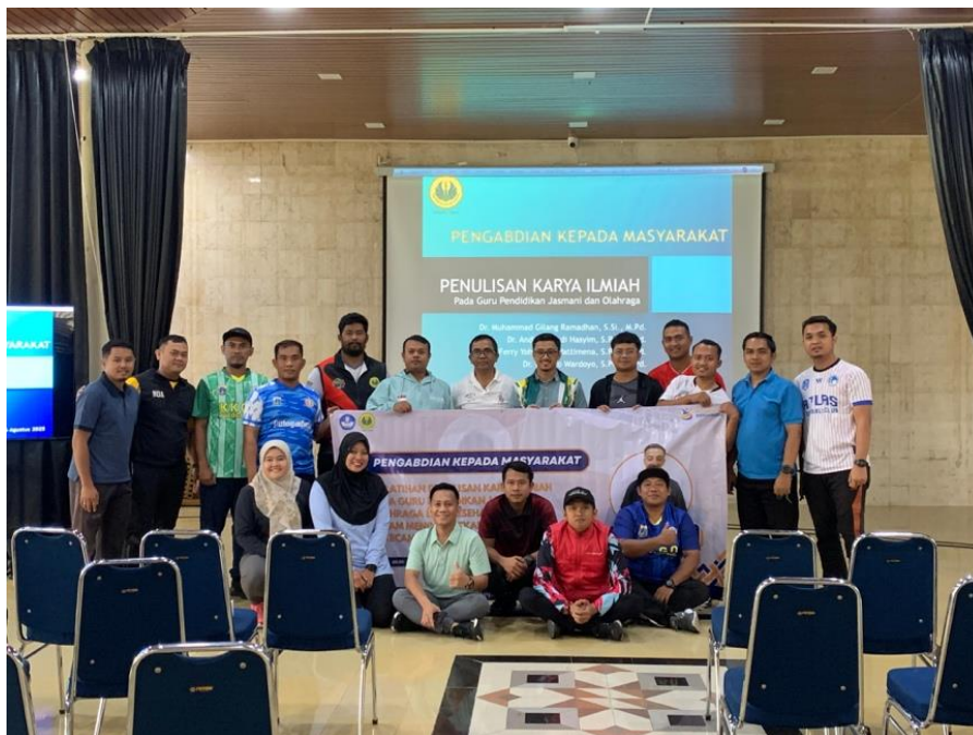
Gambar 2. Pelatihan Penulisan Karya Ilmiah

Pembentukan tim monitoring, pengembangan sistem evaluasi berkelanjutan, pembuatan mekanisme feedback regular, dan penyusunan laporan tahunan program.