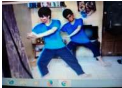
Hasil tutorial, peserta Lomba mengekspresikan Tari Nir Corona

Virtual ini memunculkan efek psikologis yang menurut Gardner bukanlah untuk kepentingan pribadi, namun kepentingan kolektif yang dapat merasakan hasil dari kreativitas personal. Setidaknya Gardner mengungkapkan ada tujuh aspek yang muncul terkait dengan belajar mandiri yakni; 1) kecerdasan linguistik; 2) kecerdasan musikal; 3) kecerdasan logis matematis; 4) kecerdasan spasial ; 5) kecerdasan tubuh kinestetik; 6) kecerdasan interpersonal; 7) kecerdasan intrapersonal (Gardner, 1983:207).