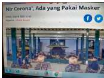
Introduksi tari Nir Corona, cuci tangan dengan hand sanitizer (screenshot, youtube, 2020)

Pola gerak Tari Nir Corona hasil stilisasi prosedur cuci tangan (screenshot, video tandhayekti, 2020)