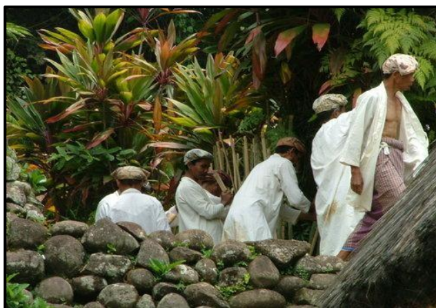
Gambar 3. Prosesi Upacara Adat Kampung Naga