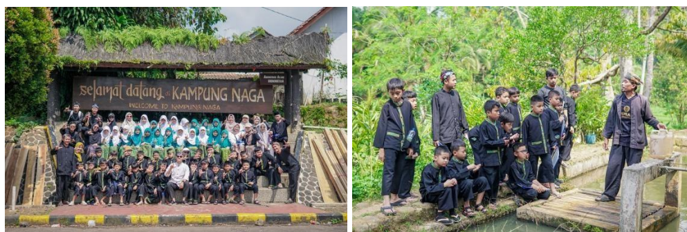
Gambar 7. HIPANA dengan Pengunjung