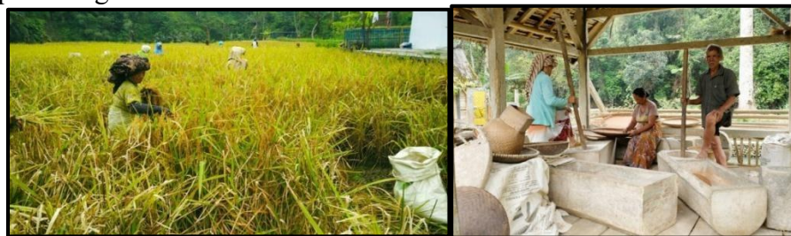
Gambar 6. Sistem Pertanian Kampung Naga

Mata pencaharian utama masyarakat Kampung Naga adalah petani, berladang dan berkebun. Sistem pertanian masyarakat Kampung Naga masih menggunakan sistem pertanian yang tradisional dengan tetap mempertahankan kearifan lokal (Prasetyo; et al., 2025). Dengan mengandalkan pupuk kandang dan teknik organik, mereka menjaga kesuburan tanah secara berkelanjutan, menekan biaya produksi, dan menghasilkan beras yang berkualitas baik. Bibit padi yang ditanam di Kampung Naga adalah bibit lokal yang umurnya 6 bulan, sehingga dalam 1 tahun panennya 2 kali. Setiap akan melakukan penanaman dan pemanenan padi selalu ada ritual yang dilakukan dengan makna menitipkan padi ke nyimas pohaci atau dewi sri supaya tidak diganggu oleh hama, dan ketika sudah waktunya panen akan dipinta lagi kepenjaganya dengan menyiapkan sesajen atau pangradinan. Dalam memanen hasil pertanian masyarakat Kampung Naga masih menggunakan etem . Berikut ini merupakan aktivitas yang dilakukan oleh masyarakat pada saat memanen padi dengan cara di etem .