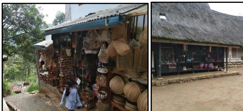
Gambar 9. Tempat menjual Kerajinan di Kampung Naga