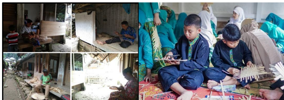
Gambar 8. Kerajinan Tangan Kecamatan Salawu

Keahlian yang dimiliki oleh masyarakat Kampung Naga adalah membuat sebuah kerajinan dari bambu (Entin et al., 2023). Pada zaman dahulu masyarakat membuat kerajinan untuk membuat perlengkapan dapur, namun pada saat ini karena permintaan yang beragam sehingga kerajinan yang dibuat pun beragam sehingga jenis kerajinan yang dibuat pun beragam mengikuti permintaan pasar.