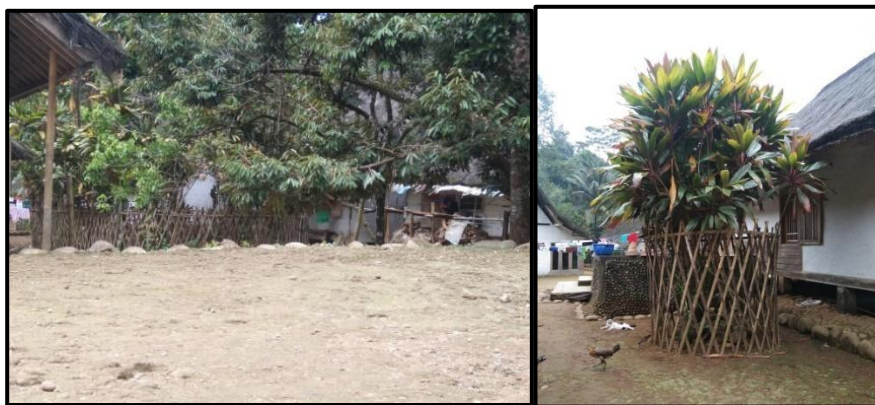
Gambar 2. Patilasan pasembahyangan dan situs lumbang

Untuk memastikan keberlanjutan hubungan spiritual dengan para leluhur, masyarakat Kampung Naga secara konsisten menjaga dan mensakralkan situs-situs historis di kawasan mereka. Di antara tempat-tempat yang dilestarikan tersebut adalah patilasan pasembahyangan , yang diyakini sebagai lokasi peribadatan para leluhur, serta situs lumbang , yakni area yang dahulu berfungsi sebagai tempat penyimpanan padi. Meskipun struktur fisik asli dari kedua tempat tersebut telah tiada seiring berjalannya waktu, eksistensi dan kesakralan lokasinya tetap dijaga dengan cermat. Sebagai penanda, ditanamlah sebuah pohon hanjuang di masing-masing kawasan tersebut, yang kini berfungsi sebagai monumen alami. Keberadaan pohon ini secara simbolis menegaskan bahwa jejak sejarah dan spiritualitas para leluhur tidak pernah hilang, melainkan terus hidup dan menyatu dengan tanah yang mereka wariskan.