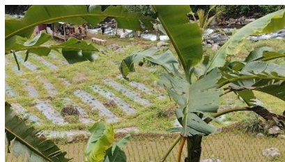
Gambar 8. (a) Perkebunan hortikultura milik kelompok tani