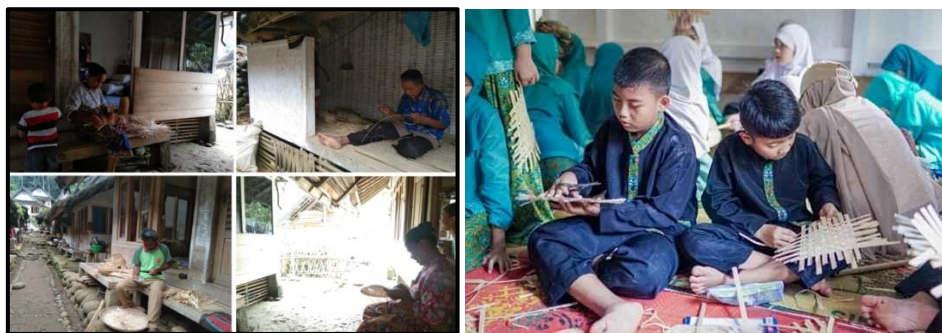
Gambar 8. Kerajinan Tangan Kecamatan Salawu

Keahlian yang dimiliki oleh masyarakat Kampung Naga adalah membuat sebuah kerajinan dari bambu (Entin et al., 2023). Pada zaman dahulu masyarakat membuat kerajinan untuk membuat perlengkapan dapur, namun pada saat ini karena permintaan yang beragam sehingga kerajinan yang dibuat pun beragam sehingga jenis kerajinan yang dibuat pun beragam mengikuti permintaan pasar.