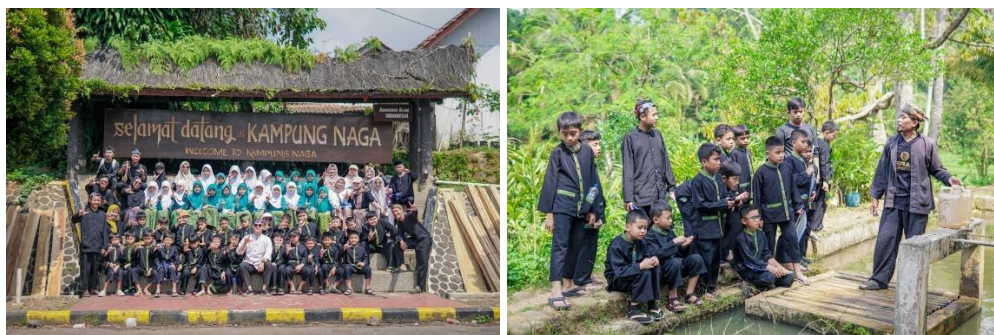
Gambar 7. HIPANA dengan Pengunjung