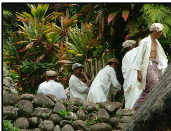
Gambar 3. Prosesi Upacara Adat Kampung Naga