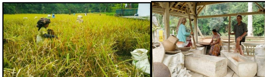
Gambar 6. Sistem Pertanian Kampung Naga

Mata pencaharian utama masyarakat Kampung Naga adalah petani, berladang dan berkebun. Sistem pertanian masyarakat Kampung Naga masih menggunakan sistem pertanian yang tradisional dengan tetap mempertahankan kearifan lokal (Prasetyo; et al., 2025). Dengan mengandalkan pupuk kandang dan teknik organik, mereka menjaga kesuburan tanah secara berkelanjutan, menekan biaya produksi, dan menghasilkan beras yang berkualitas baik. Bibit padi yang ditanam di Kampung Naga adalah bibit lokal yang umurnya 6 bulan, sehingga dalam 1 tahun panennya 2 kali. Setiap akan melakukan penanaman dan pemanenan padi selalu ada ritual yang dilakukan dengan makna menitipkan padi ke nyimas pohaci atau dewi sri supaya tidak diganggu oleh hama, dan ketika sudah waktunya panen akan dipinta lagi kepenjaganya dengan menyiapkan sesajen atau pangradinan. Dalam memanen hasil pertanian masyarakat Kampung Naga masih menggunakan etem . Berikut ini merupakan aktivitas yang dilakukan oleh masyarakat pada saat memanen padi dengan cara di etem .