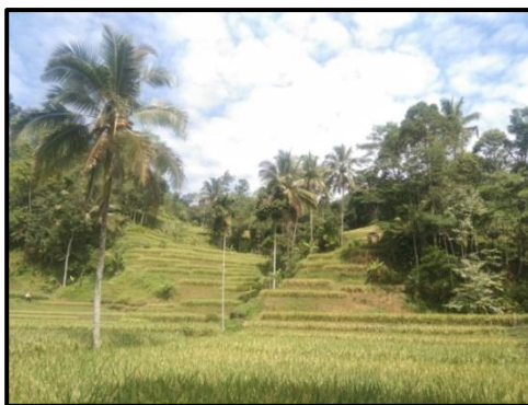
Gambar 5. Leuweung Keramat

Leuweung keramat atau hutan keramat letaknya disebelah barat pemukiman Kampung Naga. Leuweung keramat merupakan tempat pemakaman para nenek moyang atau karuhun Kampung Naga. Masyarakat adat Kampung Naga merupakan masyarakat yang mentaati aturan nenek moyang, mereka memiliki prinsip hidup “ bukan hidup dialam, tetapi hidup bersama alam ” masyarakat saling menjaga dan hidup selaras dengan alam. Area Leuweung keramat merupakan hutan yang sangat dijaga tidak diperkenankan untuk sembarang orang memasukinya, kecuali pada saat-saat tertentu dan harus didampingi oleh ketua adat atau kuncen Kampung Naga.