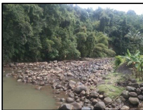
Gambar 4. Leuweung Larangan

Berdasarkan lokasinya Leuweung larangan ini terletak disebelah Timur pemukiman Kampung Naga yang bersebrangan dengan sungai ciwulan . Secara administratif kawasan Leuweung larangan ini termasuk ke desa nantang kecamatan cigalontang namun secara hak kepemilikan sepenuhnya merupakan milik masyarakat Kampung Naga.