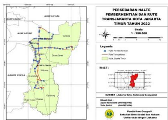
Gambar 3. Peta Persebaran Halte Pemberhentian dan Rute Transjakarta Jakarta Timur

Berdasarkan peta persebaran dan tabel data yang tersedia, sistem transportasi Transjakarta di wilayah Jakarta Timur menunjukkan pola jaringan yang cukup menyebar, terutama mengikuti jalur-jalur utama serta kawasan permukiman padat penduduk. Dalam konteks ini, terdapat total 65 halte pemberhentian Transjakarta yang tersebar di berbagai kecamatan di Jakarta Timur.