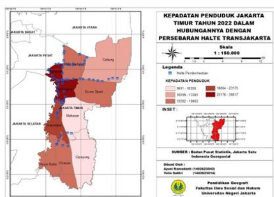
Gambar 4. Peta Kepadatan Penduduk Jakarta Timur dalam Hubungannya dengan Persebaran Halte Transjakarta