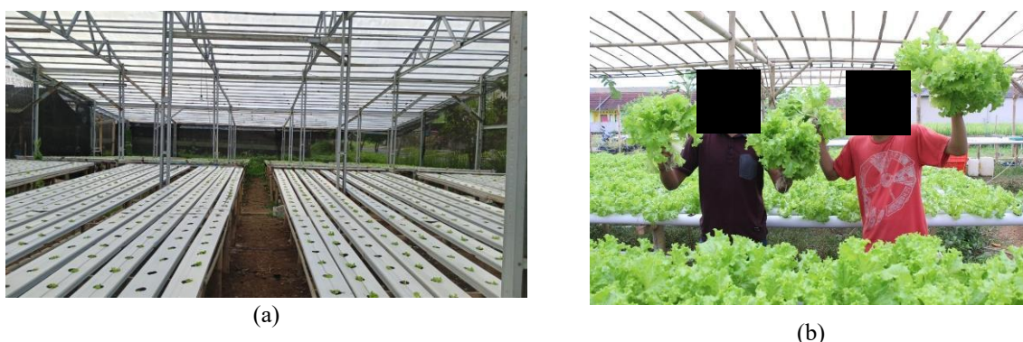
Gambar 3. (a) & (b). Aktivitas Penanaman dan Panen Selada Bokor. (Sumber: https://alazharpeduli.or.id/publikasi/artikel-berita/p/petani-milenial-desa-berdikari-tanjungpura-sukses-budidaya-selada-bokor-hidroponik dan Penulis 2025)

Selain menghasilkan produk pangan sehat, kegiatan ini membuka lapangan kerja bagi masyarakat sekitar dan menjadi contoh pemanfaatan lahan pekarangan produktif berbasis komunitas. Namun, beberapa kendala masih dihadapi seperti ketergantungan pada listrik, risiko kerusakan pompa atau penyumbatan pipa, serta pengenceran larutan nutrisi akibat hujan deras yang dapat menyebabkan penyakit mata kodok pada selada. Selain itu, serangan tikus dari area persawahan menjadi tantangan tambahan dalam proses budidaya.