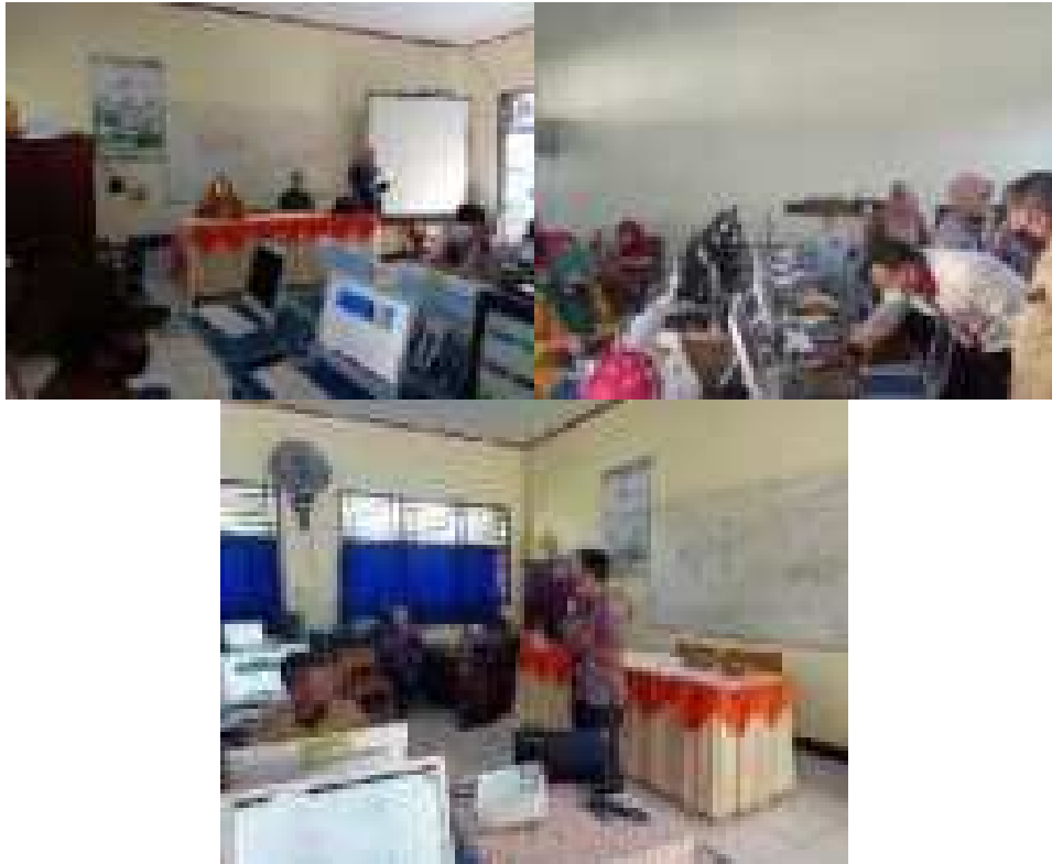
Gambar 1. Dokumentasi pelaksanaan kegiatan pelatihan pembelajaran daring

Kegiatan mandiri peserta pelatihan dilakukan sesuai waktu masing-masing guru, bila ada guru menghadapi kendala dalam kreasi pembuatan materi, pembuatan evaluasi pembelajaran dapat dikemukakan di grup WA untuk mendapat solusi. Bahkan dengan grup WA ini, para guru saling berbagi ilmu dan pengetahuan, dan membagikan tautan yang dapat membantu memecahkan permasalahan.