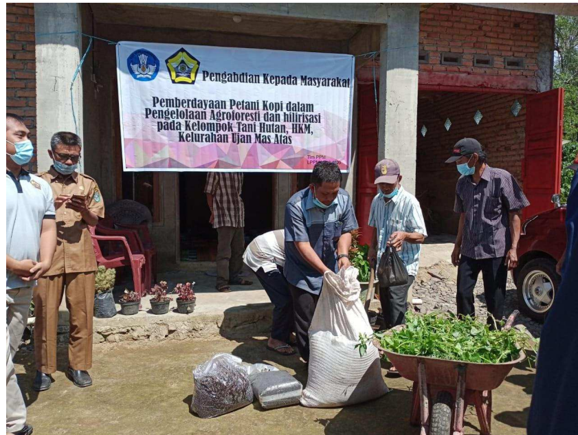
Gambar 6. Pelatihan pembuatan pupuk kulit kopi sebagai input produksi kopi

kegunaan yang banyak dalam kehidupan. Berdasarkan hasil observasi lapangan, limbah kulit kopi bermanfaat dalam bidang pertanian, peternakan dan perikanan, yaitu sebagai kompos, nutrisi protein dan serat tambahan pada pakan ternak. Limbah padat buah kulit kopi ini memiliki kadar bahan organik dan unsur hara yang dapat memperbaiki struktur tanah. Salah satu upaya yang dapat dilakukan untuk penanganan jumlah limbah kulit kopi yang semakin meningkat yaitu dengan cara pengolah limbah kulit kopi menjadi kompos.