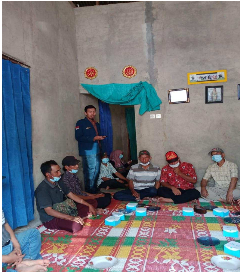
Gambar 3. Focus Group Discussion budidaya Agroforestry kopi premium

sosialisasi budidaya dilakukan dengan metode Focus Group discussion (FGD) karena pada sata pre-test diketahui bahwa pengalaman petani dalam teknis budidaya tidak perlu diragukan lagi. Sudah puluhan tahun menaungi budidaya kopi denan kualitas campuran namun perlakuan intensifikasi pemupukan belum dilaksanakan dengan baik.. Sehingga pelatihan ini akan fokus kepada perbaikan kualitas budidaya menuju budidaya yang maksimal. Pelatihan budidaya kopi juga ditujukan untuk memberikan pemahaman mengenai Jarak tanam tanaman Agroforestry dan umur ekonomis dan umur teknis dari kebun kopi serta waktu yang tepat bagi petani untuk melakukan peremajaan. Hal ini dikarenakan banyak petani yang belum begitu paham menentukan umur ekonomis tanaman kopi sehingga kopi masih dibudidayakan walaupun usia ekonomisnya sudah habis.