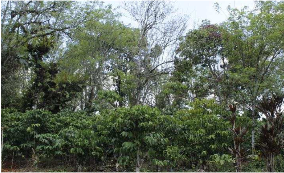
Gambar 4. Kondisi perkebunan kopi agroforestry