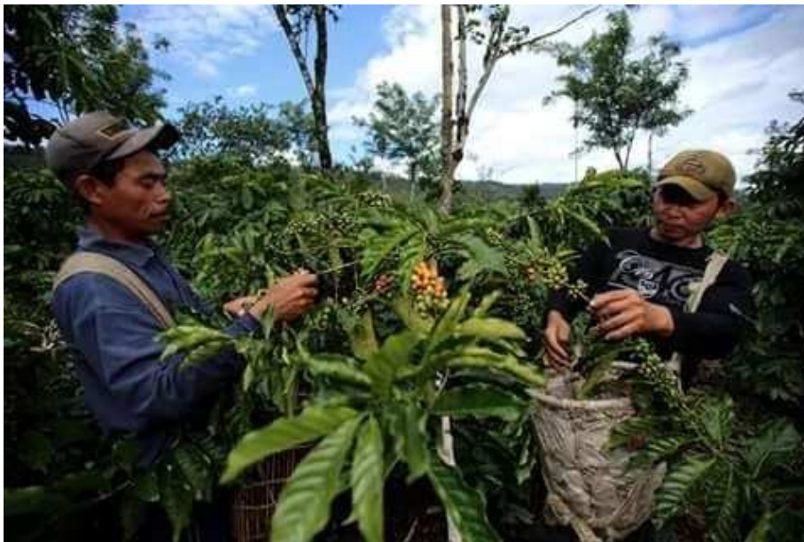
Gambar 1 Proses Pemetikan kopi di kawasan HKM Ujan Mas Atas

Budidaya kopi merupakan salah satu hal yang penting dalam rangka meningkatkan kualitas mutu. Kualitas mutu pada system budidaya kopi harus ditingkatkan untuk meningkatkan kualitas dan produktifitas perkebunan kopi di HKM Kelurahan Ujan Mas Atas. Selain itu penerapan Good Agricultural Practicess juga di berikan pelatihan, akan tetapi harus sesuai dengan kondisi perkebunan rakyat. Sehingga pelatihan ini akan focus kepada perbaikan kualitas budidaya menuju budidaya yang maksimal.