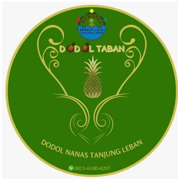
Gambar 5: Tampak Logo Dodol Nenas Tanjung Leban

Identitas produk merupakan satu elemen yang penting dalam menjadikan produk tersebut go public . Kami berupaya untuk menyajikan tampilan menarik dengan berkonsultasi pada pihak terkait khususnya Kepala Desa dan BumDesa. Pada prinsipnya, mereka mendukung upaya tersebut terlebih saat ini Desa Tanjung Leban banyak menerima tamu dari luar daerah sehingga penting bagi pihak desa memiliki produk tertentu sebagai buah tangan kebanggaan.