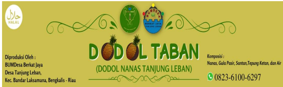
Gambar 4: Tampak Stiker Identitas Produk

Identitas produk merupakan satu elemen yang penting dalam menjadikan produk tersebut go public . Kami berupaya untuk menyajikan tampilan menarik dengan berkonsultasi pada pihak terkait khususnya Kepala Desa dan BumDesa. Pada prinsipnya, mereka mendukung upaya tersebut terlebih saat ini Desa Tanjung Leban banyak menerima tamu dari luar daerah sehingga penting bagi pihak desa memiliki produk tertentu sebagai buah tangan kebanggaan.