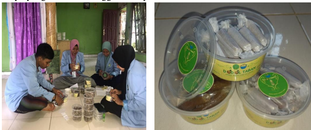
Gambar 3: Pengemasan Dodol Nenas

Ibu-ibu PKK bergerak aktif dan antusias mengajarkan serta mempraktikkan tahapan produksi dodol nenas kepada mahasiswa yang terlibat dalam kegiatan ini. Masing-masing diajarkan bagaimana membuat dodol nenas dari tahapan memilih bahan baku hingga tahap akhir. Pada praktiknya, kami mendorong penggunaan bahan-bahan lokal yang didapat dan diolah sendiri. Penggunaan bahan-bahan lokal ini dengan tidak memakai sedikitpun bahan baku yang bersifat kimia ditujukan agar hasil akhir dapat jauh lebih baik dari sisi rasa maupun ketahanan produk. Kegiatan pengembangan dodol nenas dilakukan dengan tidak memasukkan unsur baru pada bahan baku yang digunakan. Cita rasa original yang ada tetap dipertahankan sebab tujuan utama terletak pada pengembangan yang telah difokuskan pada pengemasan agar nilai jual produk dodol nenas dapat meningkat jika dibandingkan dengan sebelumnya yang dikemas menggunakan plastik biasa.