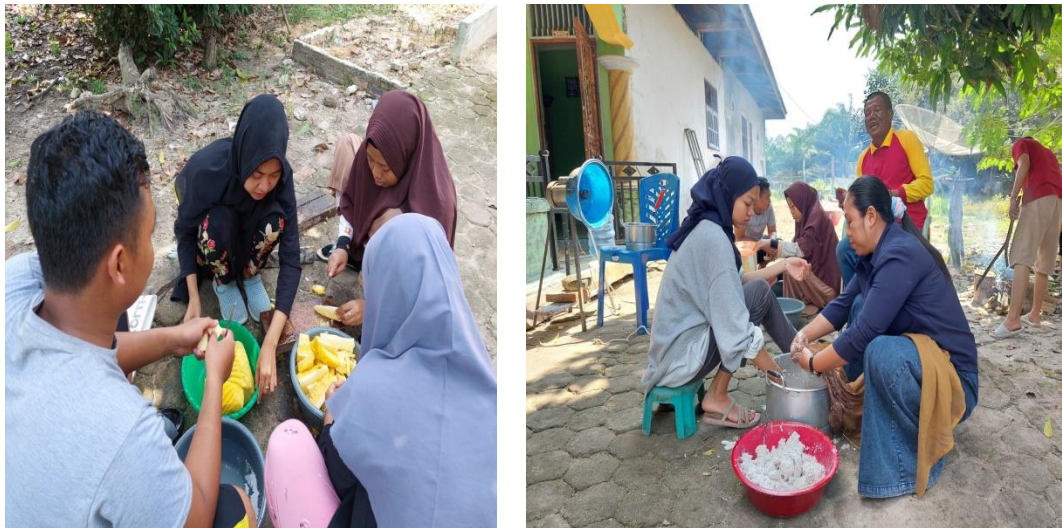
Gambar 2: Praktik Pembuatan Dodol Nenas

Ibu-ibu PKK bergerak aktif dan antusias mengajarkan serta mempraktikkan tahapan produksi dodol nenas kepada mahasiswa yang terlibat dalam kegiatan ini. Masing-masing diajarkan bagaimana membuat dodol nenas dari tahapan memilih bahan baku hingga tahap akhir. Pada praktiknya, kami mendorong penggunaan bahan-bahan lokal yang didapat dan diolah sendiri. Penggunaan bahan-bahan lokal ini dengan tidak memakai sedikitpun bahan baku yang bersifat kimia ditujukan agar hasil akhir dapat jauh lebih baik dari sisi rasa maupun ketahanan produk. Kegiatan pengembangan dodol nenas dilakukan dengan tidak memasukkan unsur baru pada bahan baku yang digunakan. Cita rasa original yang ada tetap dipertahankan sebab tujuan utama terletak pada pengembangan yang telah difokuskan pada pengemasan agar nilai jual produk dodol nenas dapat meningkat jika dibandingkan dengan sebelumnya yang dikemas menggunakan plastik biasa.