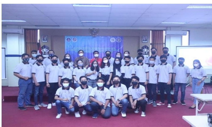
Gambar 4. Dokumentasi Kegiatan Dihari Pertama

Gambar 2 dan 3. Menunjukkan pelaksanaan kegiatan pelatihan personal branding dan public speaking kepada FDLH. Upaya ini sebagai bentuk eksistensi Politeknik Negeri Balikpapan dalam berkontribusi membangun SDM, melalui program PKM dalam bentuk memberikan pelatihan kepada Forum Duta Lingkungan Hidup Balikpapan dengan materi yang meliputi penguatan personal branding dengan didukung kemampuan public speaking , serta materi tentang kesehatan, keselamatan, kerja dan lingkungan hidup (K3LH).