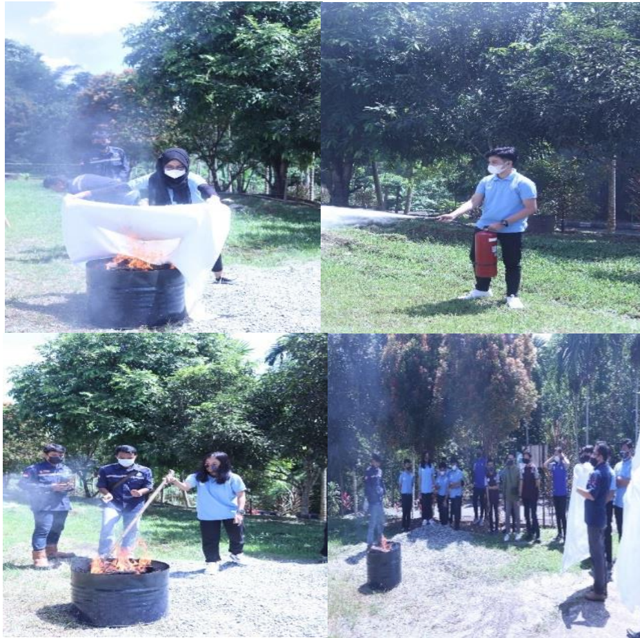
Gambar 5. Dokumentasi Kegiatan Dihari Pertama