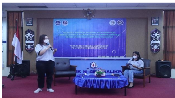
Gambar 2. Pelatihan Personal Branding

Kegiatan PKM ini merupakan suatu pemecahan permasalahan yang terjadi pada mitra kegiatan pengabdian ini. Masalah yang sering timbul adalah kurangnya kepercayaan diri oleh duta lingkungan hidup Balikpapan. Menyandang sebagai duta lingkungan hidup Balikpapan adalah tugas yang melekat bagi mereka khususnya untuk menyebarkan segala kegiatan-kegiatan yang positif bagi pemuda dan pemudi kota Balikpapan. Permasalahan yang mendasar adalah duta lingkungan hidup memiliki keterbatasan pengetahuan tentang konsep lingkungan hidup yang ada di kota Balikpapan. Perlunya kegiatan pelatihan personal branding yang didukung dengan peningkatan kemampuan public speaking bagi Forum Duta Lingkungan Hidup Balikpapan sebagai pembekalan sebelum mereka terjun ke masyarakat untuk melakukan sosialisasi mengenai konsep lingkungan hidup di kota Balikpapan. Duta lingkungan hidup harus memiliki brand yang baik tentang diri mereka, dan juga dapat mengedukasi masyarakat akan pentingnya menjaga lingkungan alam Balikpapan dan sekitarnya. Pelaksanaan kegiatan pelatihan di hari pertama diperlihatkan pada Gambar 2, 3 dan 4.