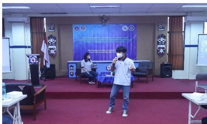
Gambar 3. Pelatihan Public Speaking