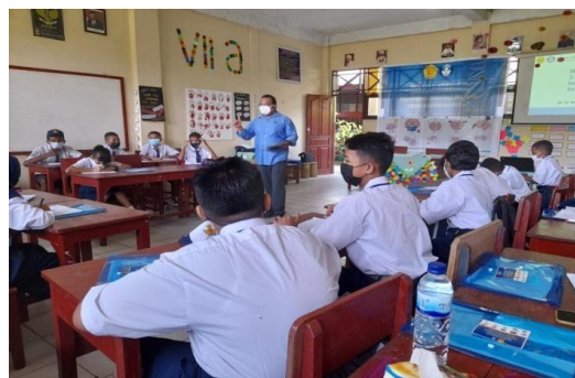
Gambar 3. Suasana penyampaian materi pelatihan di kelas

Materi disajikan dalam bentuk slide power point di dalam ruang kelas. Materi teori dan praktik dalam bentuk games , refleksi dan main peran dilakukan selama pemberian materi dilakukan. Modul khusus yang digunakan sebagai sumber materi pelatihan ini telah dirancang sedemikian rupa secara efektif, efisien dengan berpatokan pada konten teori dan aplikasi yang praktis.