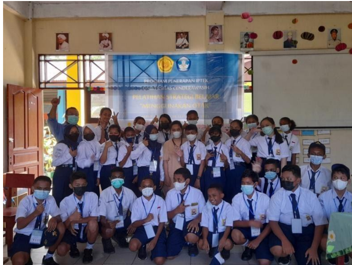
Gambar 2. Peserta Pelatihan Belajar “ Menggunakan Otak”

Pelatihan Penerapan Strategi Belajar “Menggunakan Otak” Untuk Peningkatan Kemampuan dan Prestasi Belajar Siswa di SLTP Negeri 3 Jayapura. Kegiatan dilakukan selama dua hari secara intensif dalam ruang kelas dan mengikuti protokol kesehatan secara ketat. Kegiatan pelatihan dilaksanakan pada 23-24 September 2021 pada jam 08.30 s/d 14.30 WIT. Pelatihan diikuti oleh siswa kelas 7,8 dan 9 yang dipilih dan ditentukan oleh pihak guru sekolah.