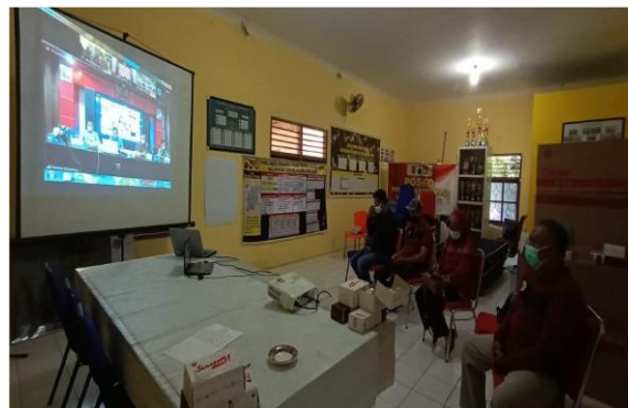
Gambar 4. Penguatan Manajemen Kelompok Gerbang Elok

Pada kegiatan manajemen kelompok dihadiri oleh pengurus kelompok beserta aparat kelurahan yang selalu mendukung adanya kegiatan pengabdian. Pihak kelurahan sangat berterima kasih atas dukungan tim pengabdian UNNES dalam mendukung Kampung Tematik di wilayahnya.