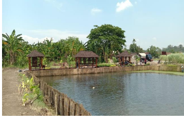
Gambar 3. Proses pembangunan sarpras kolam pancing Kelompok Gerbang Elok