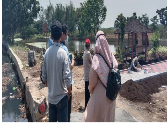
Gambar 2. Pelaksanaan pembangunan kolam Pancing Gerbang Elok

lingkungan. Lokasi kolam ikan yang berada di lahan bondo deso, tentunya juga menjadikan kenyamanan bagi tim Gerbang Elok dalam mengembangkan program-programnya di tahun-tahun mendatang, karena lahan merupakan lahan milik pemerintah Kota Semarang. Disamping itu dalam penentuan lahan juga melibatkan berbagai pihak tokoh masyarakat, sehingga keberadaan kolam pancing tersebut sangat di dukung oleh pihak kelurahan, LPMK serta tokoh-tokoh masyarakat yang lain.