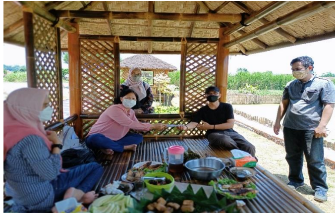
Gambar 5. Pemberian Bantuan Keuangan untuk Kas Kelompok Gerbang Elok