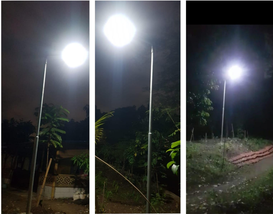
Gambar 3. Tiga sistem-penerangan berbasis PLTS saat malam-hari