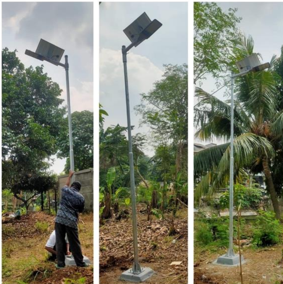
Gambar 2. Hasil instalasi tiga sistem-penerangan berbasis PLTS

Sistem-penerangan berbasis PLTS telah selesai diinstall di tiga-area Hutan Kota Lamping RW-03 Kelurahan Jatinegara Kaum pada akhir bulan Juli 2022 dengan spesifikasi masing-masing komponen, yaitu: (1) Modul sumber cahaya-penerangan menggunakan 216-buah LED SMD-5730 (dihubungkan secara paralel); (2) Modul panel-surya berbahan Polycrystalline-Silicon 5Volt 35Watts; (3) Modul baterai jenis LiFePO4 3,2Volt 36AH yang dilengkapi dengan Baterai Management System; dan (4) Modul kendali pembatasan-arus ke modul LED SMD (ON/OFF secara otomatis dengan tiga pilihan tingkat-iluminasi). Ketinggian sistem-penerangan berbasis PLTS setinggi 4-meter menggunakan pipa-Galvanis 2-inchi dengan pondasi-cor. Tiga sistem-penerangan berbasis PLTS telah diuji dan diukur dapat menghasilkan cahaya saat malam-hari (saat tidak ada cahaya Matahari) dengan nilai Iluminasi dengan rentang 11.000Lux sd 12.000Lux selama 12jam (jika panel-surya mendapat paparan cahaya-Matahari secara penuh selama 6jam). Gambar 2 menunjukkan hasil instalasi tiga sistem-penerangan berbasis PLTS di area Hutan Kota Lamping RW-03 Kelurahan Jatinegara Kaum Jakarta Timur. Gambar 3 menunjukkan 3 (tiga) sistem-penerangan berbasis PLTS saat malam-hari.