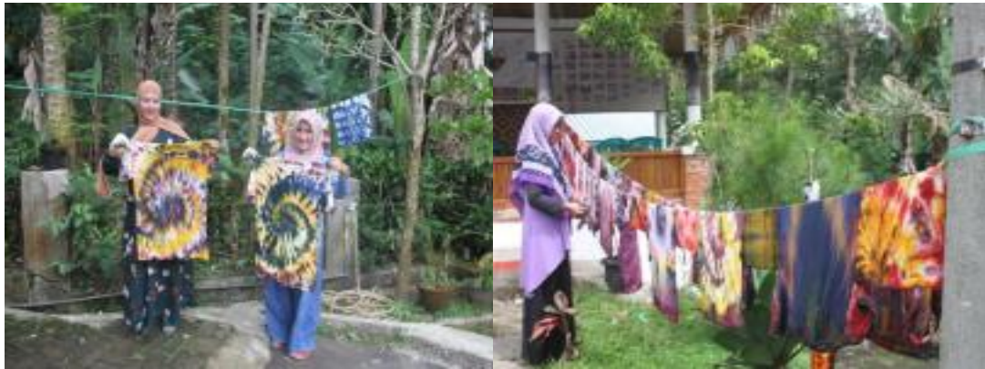
Gambar 2. Kegiatan Pelatihan