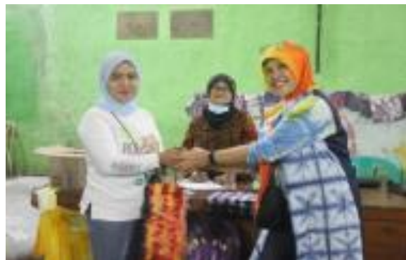
Gambar 7. Pemberian Reward bagi karya yang baik dan indah

Kegiatan pengabdian masyarakat ini telah di publish ke harian media galagala.id, https://galagala.id/berkat-pengabdian-unj-warga-cisaat-mampu-berproduktivitas-sovenir/