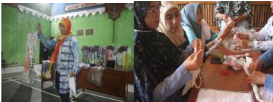
Gambar 3. Penyampaian materi Mempraktekan langsung kelompok 1