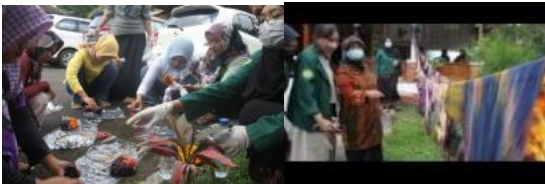
Gambar 6. Proses pemberian warna Proses penjurian hasil karya