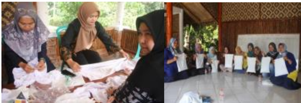
Gambar 4. Kelompok 2 saat mempraktekan langsung produk tiedye