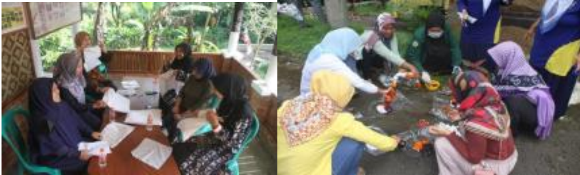
Gambar 5. Kelompok 3 berdiskusi membuat motif Proses pemberian warna