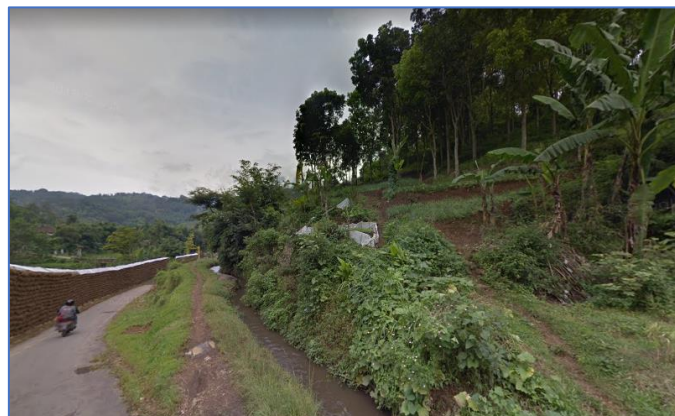
Gambar 2 Kondisi jalan tanpa lampu

Untuk mengetahui detail permasalahan yang tepat, maka dilakukan survey ke lokasi pengabdian yang tempatnya berada di Desa Purworejo Kecamatan Ngantang Kabupaten Malang. Berikut ini dokumentasi hasil surveinya.