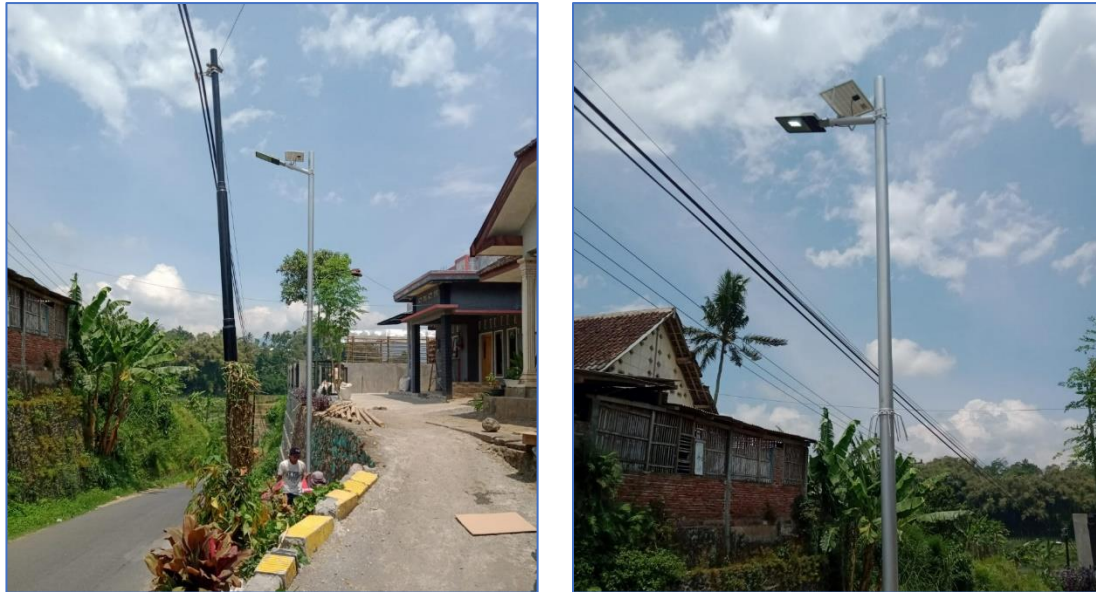
Gambar 6 PJU Bertenaga Surya terpasang