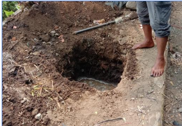
Gambar 27 Lubang Dudukan Tiang PJU