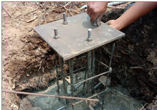
Gambar 28 Pemasangan Dudukan PJU