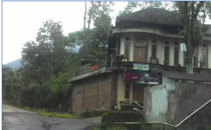
Gambar 3 Kondisi Persimpangan