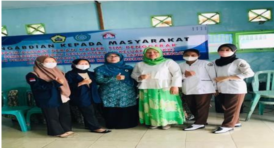
Gambar 3. Foto anggota Pengabdian kepada Masyarakat