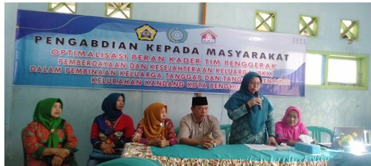
Gambar 1. Sambutan Ketua Bidang I TP-PKK Kota Bengkulu, sekaligus membuka acara dengan resmi.

posyandu kelurahan 18 orang dan anggota dasawisma dari beberapadasawisma kelurahan kandang 10 orang. Pelatihan ini di mulai setelah acara pembukaan secara resmi di lakukan, dari jam 10.00 – 11.30 WIB kemudian dilanjutkan jam 13.30 – 15.30 WIB.