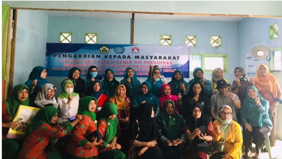
Gambar 2. Foto bersama Kader PKK Kota Bengkulu

memotivasi pasangan usia subur dalam tatanan keseharian di wilayah Kelurahan Kandang Kecamatan Kampung Melayu Kota Bengkulu yang di pimpin langsung oleh Ketua PKK Kelurahan Kandang.