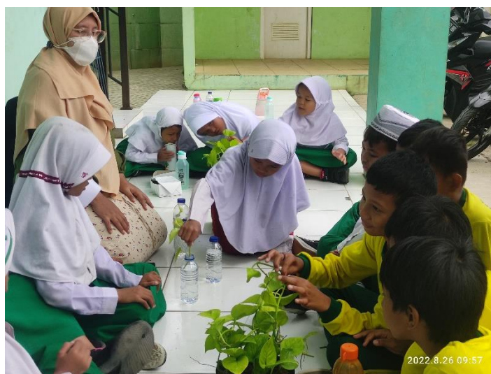
Gambar 2. Memanfaatkan botol bekas menjadi pot tanaman/ media tanam

Pada tahap pertama kegiatan dilakukan dengan memberikan edukasi lingkungan kepada peserta didik, yakni materi identifikasi sampah dan cara meminimalisirnya melalui konsep 3 R ( Reduce, Reuse, dan Recycle ) melalui metode penyuluhan dan tanya jawab. Saat kegiatan berlangsung, peserta didik sangat antusias. Peserta didik yang dapat menjawab pertanyaan mendapatkan hadiah. Usai kegiatan penyuluhan, peserta didik diarahkan ke teras kelas untuk dikenalkan melestarikan lingkungan dengan menanam tanaman, dalam hal ini tanaman sirih gading. Sirih gading merupakan tanaman yang mampu menyerap polusi dan mudah berkembang biak dalam segala suhu. Mereka diminta untuk mencari botol bekas air isi ulang yang kemudian diisi air sebagai media tanamnya. Adapun aktivitas tersebut tergambar pada gambar 2 berikut ini: