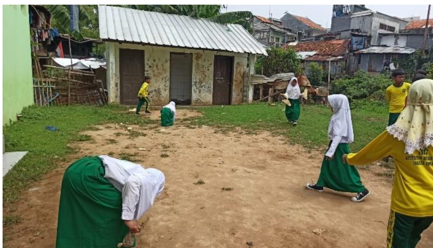
Gambar 2 Peserta didik sedang kerja bakti membersihkan lingkungan sekolah

Pada tahap kedua, ketika peserta didik berkegiatan di teras kelas, peserta lainnya yakni para guru dan komite sekolah diberikan penyuluhan tentang Bank Sampah dan rencana pembentukannya. Sebagai edukasi awal, peserta dikenalkan jenis bank sampah, mekanisme pembentukan bank sampah, kepemilikan buku tabungan, dan susunan pengurus bank sampah.