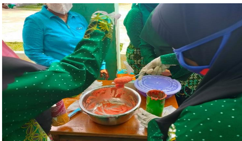
Gambar 4. Peserta kegiatan dilatih membuat sabun dari minyak jelantah

Kemudian setelah itu peserta pelatihan melakukan daur ulang limbah dengan memanfaatkan minyak jelantah menjadi sabun. Adapun aktivitas tersebut tergambar pada gambar 4 berikut ini: