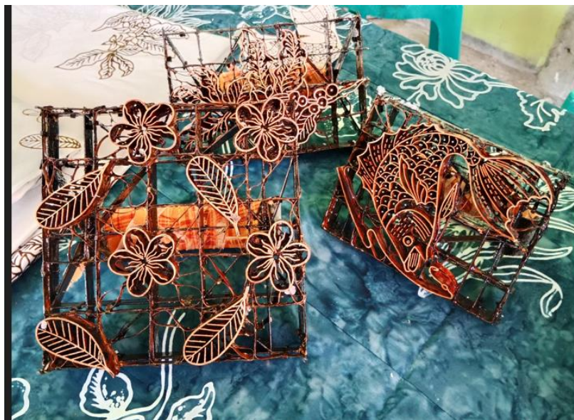
Gambar 1. Dokumentasi Serah Terima Bantuan Peralatan, Alat batik cap

Kegiatan pengabdian masyarakat ini dimulai dengan memberikan bantuan berupa peralatan yang digunakan untuk membuat batik cap.