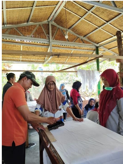
Gambar 2. Dokumentasi Pembuatan batik cap

Pada saat setelah penyampaian materi para peserta dapat langsung mencoba membuat batik cap dengan menggunakan bahan-bahan yang telah disediakan.