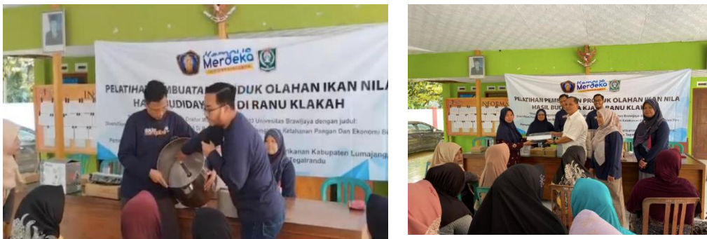
Gambar 3. Demo dan Penyerahan Alat Produksi Diversifikasi Pangan

Untuk membantu proses pemasaran, pada kegiatan Doktor Mengabdikan 2023 ini diberikan demonstrasi cara mengeringkan produk keripik kulit ikan setelah digoreng menggunakan mesin spinner yang berfungsi memisahkan minyak yang terkandung dalam keripik saat proses penggorengan. Dalam proses pemisahan ini, produk akan ditiriskan secara otomatis sehingga keripik akan lebih cepat kering dan siap untuk dikemas. Setelah itu, keripik dikemas menggunakan metode pengemasan vakum sehingga akan memperpanjang usia penyimpanan produk. Selain itu, produk dapat lebih awet serta terjaga rasa dan kerenyahannya. (Q et al., 2016) Gambar 3 memberikan dokumentasi demonstrasi penggunaan peralatan spinner dan vakum. Peralatan ini kemudian diserahkan pada kelompok pembudidaya untuk dapat dimanfaatkan dalam kegiatan usaha sehari-hari.