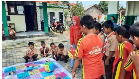
Gambar 5. Tim Pelaksana Menjelaskan Cara Bermain

Sosialisasi dilanjutkan dengan metode bermain. Kali ini, peserta dibagi menjadi beberapa kelompok untuk memainkan permainan edukatif rainbow rocket secara berkelompok dan bergantian. Setiap kelompok terdiri atas 6 siswa yang akan bergantian melempar dadu. Sesi ini dilaksanakan di lapangan sekolah, sehingga memungkinkan siswa lain dan orangtua untuk ikut menyaksikan. Sebelum memulai permainan, tim pelaksana menjelaskan aturan dan cara bermainnya terlebih dahulu. Terlihat bahwa peserta menyimak dengan penuh antusias.