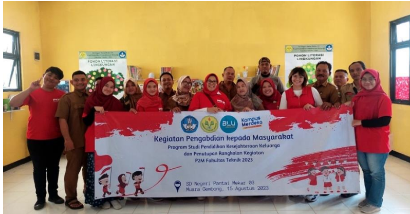
Gambar 8. Foto Tim Pelaksana dengan Guru Sekolah

Di siang hari, sosialisasi sudah selesai dilaksanakan dan perpustakaan sudah rapi. Tim pelaksana mengundang kepala sekolah untuk meresmikan perpustakaan. Selain itu, guru-guru juga diundang hadir untuk melihat wajah baru perpustakaan SD Negeri Pantai Mekar 03. Kegiatan diakhiri dengan penyerahan plakat dan foto bersama.