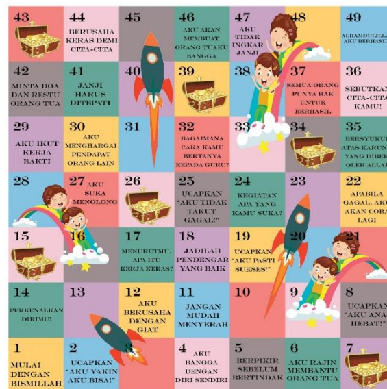
Gambar 4. Desain Rainbow Rocket

Dalam pemilihan permainan edukasi, tim pelaksana menginginkan penekanan pada internalisasi nilai-nilai karakter pada anak. Sehingga dipilihlah permainan rainbow rocket. Permainan rainbow rocket merupakan permainan ular tangga besar, dengan gambar ular diganti rainbow, sedangkan gambar tangga diganti rocket. Setiap kotak (pijakan) pada papan berisi nilai-nilai karakter yang mencerminkan kerja keras dan percaya diri. Tidak ada pion yang digunakan dalam permainan, karena anak itu sendiri yang akan menjadi pionnya. Sehingga media permainan edukatif rainbow rocket dibuat dalam ukuran yang cukup besar agar anak-anak dapat bermain langsung di atasnya. Rainbow rocket ini berisi 49 nomor yang dilengkapi dadu dan kartu istimewa. Setiap kotak berukuran 40 cm x 40 cm. Rainbow rocket dimainkan dengan dadu berukuran 30 cm x 30 cm.