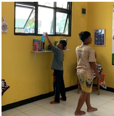
Gambar 10. Siswa Mencari Buku yang Akan Dibaca

Setelah perpustakaan resmi dibuka, terlihat beberapa guru dan siswa mengamati buku-buku bacaan. Meskipun sudah di luar jam sekolah, terlihat beberapa siswa antusias mencari buku bacaan yang cocok. Semoga dengan adanya perpustakaan ini, literasi siswa bisa meningkat. Sekolah dapat merutinkan Gerakan Literasi Sekolah (GLS) dan dapat mendukung ketercapaian program pemerintah.