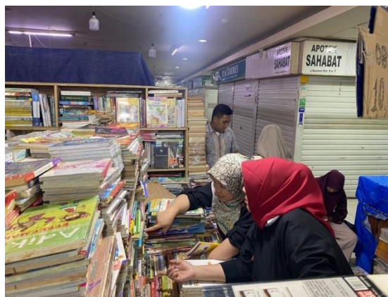
Gambar 3. Menyeleksi Buku

Buku-buku yang sudah diseleksi, selanjutnya akan didata sebagai inventori. Setiap buku yang akan dibawa ke perpustakaan, akan ditandai dengan stemple Program Studi Pendidikan Kesejahteraan Keluarga. Selain buku, tim pelaksana juga menyeleksi poster dan permainan edukatif yang dapat digunakan untuk mengoptimalkan tumbuh kembang anak di sekolah.