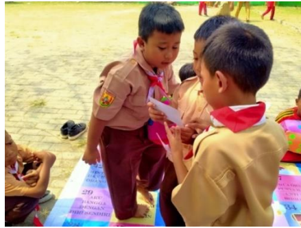
Gambar 6. Peserta Membaca Pesan Rahasia

Tim pelaksana mengapresiasi partisipasi peserta. Terlebih, banyak peserta yang memiliki rasa ingin tahu yang tinggi dan berupaya keras untuk menyelesaikan permainan dengan kemenangan. Tim pelaksana memberikan bingkisan pada peserta yang berhasil finish lebih dulu dalam permainan.