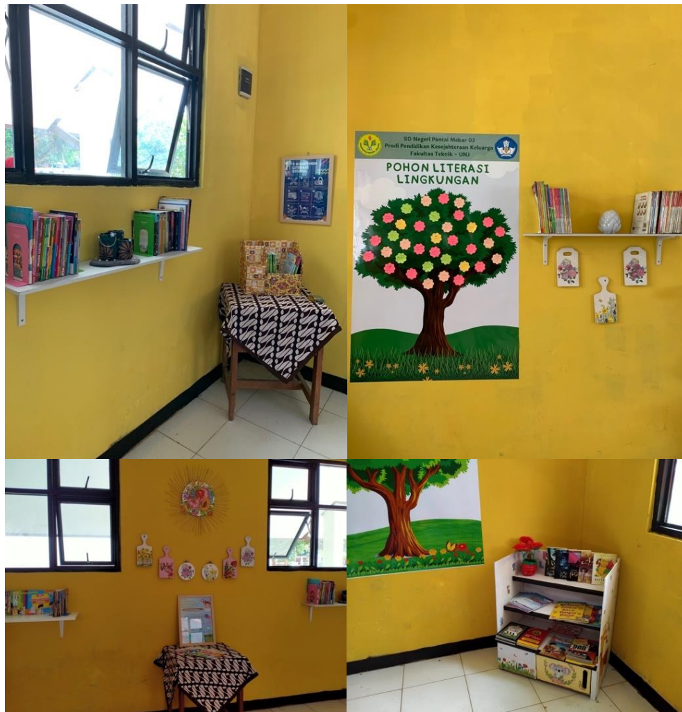
Gambar 7. Pojok-pojok perpustakaan

Sekolah menyediakan sebuah ruangan kosong yang boleh dijadikan perpustakaan. Secara paralel, tim pelaksana merapikan ruangan tersebut dan menata buku-buku bacaan agar mudah diakses dan dibaca oleh warga sekolah. Tim pelaksana menyusun buku berdasarkan klasifikasi jenisnya.