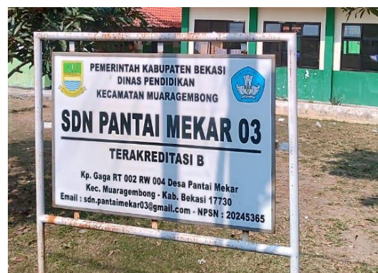
Gambar 2. SD Negeri Pantai Mekar 03

Selanjutnya tim pelaksana mengajukan perizinan pelaksanaan kegiatan kepada Kepala Desa Pantai Mekar. Tim pelaksana menghubungi Pak rahmat selaku PIC Desa Pantai Mekar sejak awal Juli 2023. Bersama Pak Rahmat, tim pelaksana mengidentifikasi potensi sekolah yang cocok untuk kegiatan. Setelah melakukan diskusi dengan pihak internal dan eksternal, tim pelaksana memutuskan untuk memilih SD Negeri Pantai Mekar 03 sebagai lokasi kegiatan. Sekolah tersebut berlokasi di Kp. Gaga RT 002 RW 004, Desa Pantai Mekar, Kecamatan Muara Gembong. Pemilihan sekolah ini mempertimbangkan kondisi aktual dan terkini sekolah, serta jumlah siswa dan guru yang ada di sekolah tersebut.