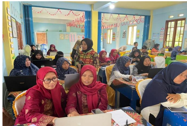
Gambar 3. Suasana pelatihan yang didampingi fasilitator

Pelaksanaan kegiatan pengabdian ini diawali dengan melakukan pretest untuk mengetahui tingkat pemahaman dan pengetahuan para guru tentang media pembelajaran yang meliputi urgensi media, pengembangan media menggunakan aplikasi Sway dan Liveworksheet yang dapat digunakan dalam proses belajar.