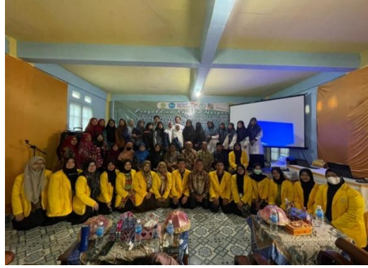
Gambar 2. Foto bersama narasumber, peserta, dan tim pengabdian

Pelaksanaan kegiatan pengabdian ini diawali dengan melakukan pretest untuk mengetahui tingkat pemahaman dan pengetahuan para guru tentang media pembelajaran yang meliputi urgensi media, pengembangan media menggunakan aplikasi Sway dan Liveworksheet yang dapat digunakan dalam proses belajar.