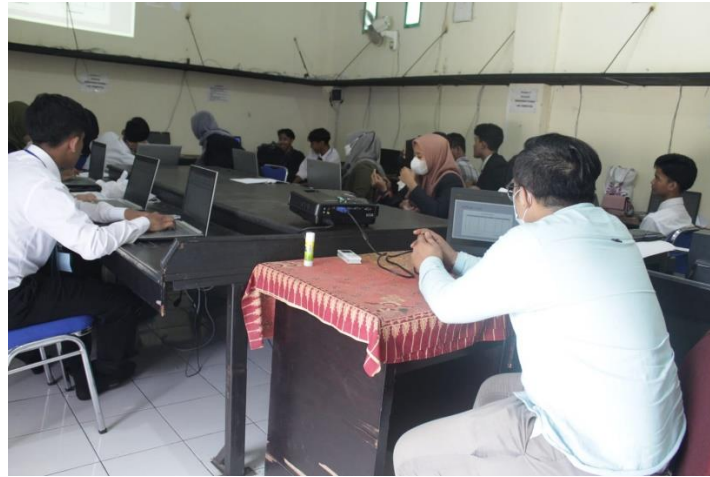
Gambar 1. Pelatihan Uji Kompetensi