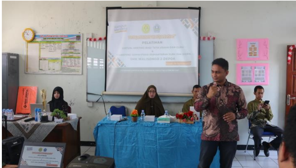
Gambar 2. Pengabdian Masyarakat SMK 2 Walisongo Depok

Kegiatan pengabdian masyarakat ini juga menghasilkan luaran tambahan yang memiliki nilai lebih dalam pengembangan ilmu pengetahuan dan kekayaan intelektual: