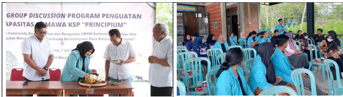
Gambar 6. Focus Discussion Group (FGD) PPK Ormawa KSP “Principium” FH UNS