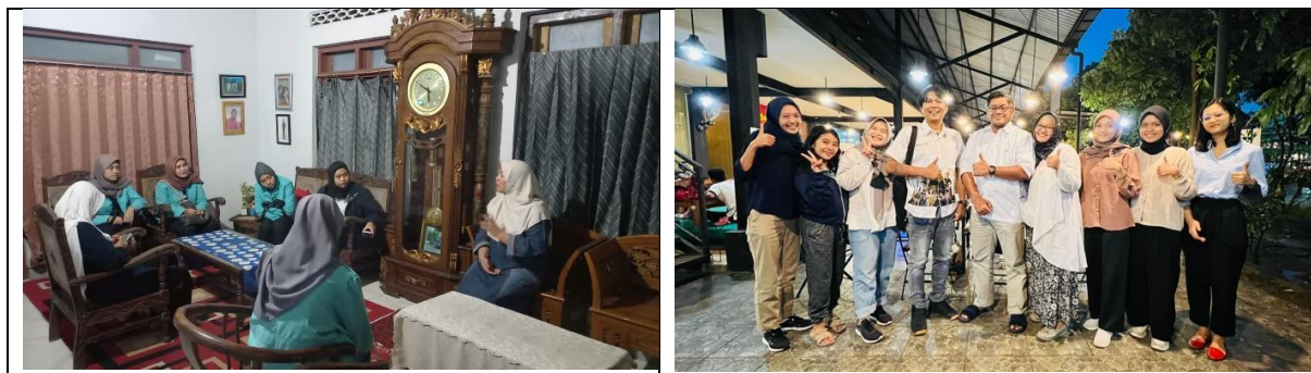
Gambar 5. Wawancara dengan UMKM dan Diskusi dengan Tim Pengembang Pariwisata Desa Banyuwangi