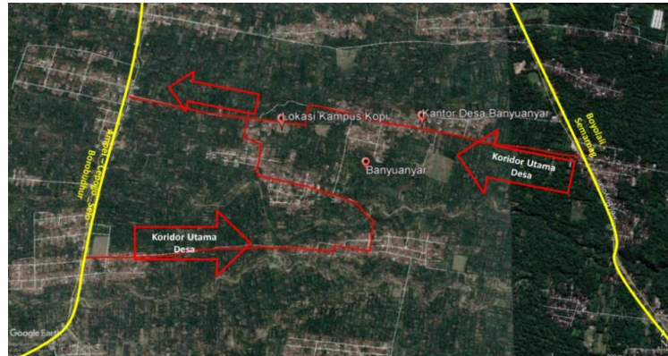
Gambar 4. Lokasi Desa Banyuwangi menjadi Penghubung Antara Jalur Utama Tol Trans Jawa Menuju Jalur Solo-Selo-Borobudur (SSB)