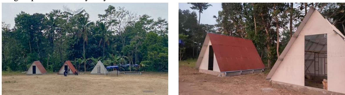
Gambar 8. Proses Pembangunan Barendo Coffee Land and Nature Camp

Pembangunan Barendo Coffee Land and Nature Camp dilakukan dengan partisipasi masyarakat desa dan memanfaatkan potensi lokal desa, salah satunya dengan melibatkan tenaga kerja yang berasal dari penduduk lokal. Barendo Coffee Land and Nature Camp dibangun di Lapangan Gedung Industri Kecil Masyarakat (IKM) Kampus Kopi dengan pertimbangan letak yang strategis dan fasilitas yang memadai. Adanya destinasi baru berbentuk camping site tersebut mengintegrasikan kegiatan pariwisata yang melibatkan UMKM Desa Banyuwangi dengan model paket tour wisata. Pada konsep tour wisata tersebut, wisatawan mengelilingi kampung-kampung UMKM menggunakan transportasi lokal berupa mobil pick up . Barendo Coffee Land and Nature Camp yang mengadopsi konsep nomadic tourism sebagai tempat istirahat bagi para wisatawan setelah melakukan tour wisata ditujukan untuk menambah durasi kunjungan wisatawan sehingga wisatawan memiliki waktu yang lebih untuk mengeksplor Desa Banyuwangi.