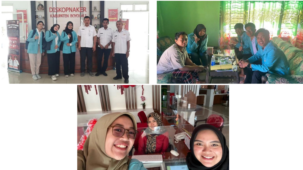
Gambar 8. Pendampingan Pendaftaran Legalitas Usaha