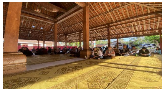
Gambar 9. Lokakarya dan Audiensi