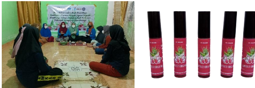
Gambar 3. Pelatihan Pemanfaatan Limbah Kulit Buah Naga dan Aloe vera serta Produk yang Dihasilkan Berupa Liptint Organik Multifungsi

untuk pembuatan produk liptint organik ramah kantong dari limbah kulit buah naga dan aloevera dapat dilihat pada gambar 3.