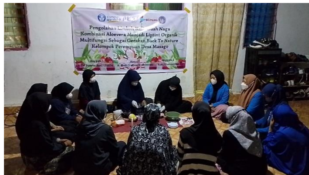
Gambar 4. Pendampingan dan Evaluasi Mitra

Pendampingan dilaksanakan untuk mengevaluasi kemampuan mitra dalam membuat sekaligus kemampuan mitra akan mengembangkan produk kosmetik berupa liptint organik ramah kantong serta produk turunan berupa libscrub yang dihasilkan. Kegiatan yang dilaksanakan pada tahap evaluasi adalah diskusi mengenai kendala mitra, serta pengembangan pemasaran sebagai pelatihan tambahan. Pendampingan dilaksanakan untuk mengevaluasi kemampuan mitra dalam membuat sekaligus kemampuan mitra akan mengembangkan produk yang dihasilkan (Asfar et al. , 2021; Asfar et al. , 2020). Berdasarkan hasil pendampingan, diperoleh bahwa mitra telah mampu mengolah limbah kulit buah naga kombinasi aloevera menjadi liptint organik ramah kantong.