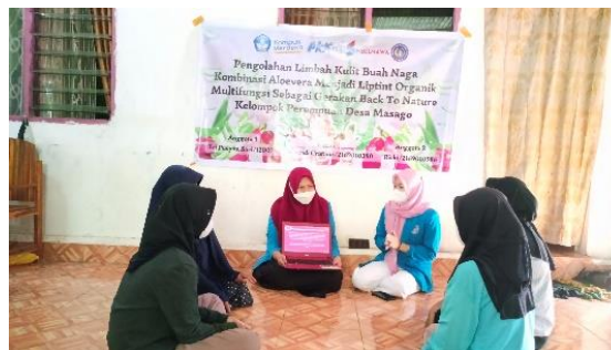
Gambar 2. Sosialisasi secara luring mengenai Pemanfaatan Limbah Kulit Buah Naga dan Aloevera

Penyuluhan merupakan kegiatan yang dilaksanakan sebagai bentuk sosialisasi kepada mitra (Asfar et al. , 2020). Tahap sosialisasi dilakukan seminar singkat secara luring dengan tetap mematuhi protokol kesehatan mengenai kulit buah naga dan aloevera serta cara pengolahannya. Tahapan ini dilakukan dengan bentuk diskusi dan seminar singkat (Asfar et al. , 2022) mengenai pemanfaatan limbah kulit buah naga kombinasi aloevera . Hasil sosialisasi ini memberikan gambar jelas kepada mitra mengenai kegiatan yang akan dilaksanakan yaitu pembuatan liptint organik ramah dikantong dari limbah kulit buah naga kombinasi aloevera dapat dilihat pada gambar 2.