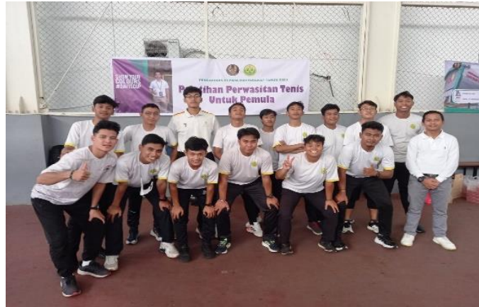
Gambar 2. Penjelasan dan Praktek Materi di Lapangan