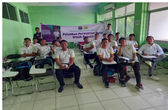
Gambar 3. Penjelasan Materi di Kelas