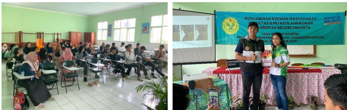
Gambar 3. Foto peserta dan penyerahan buku teknik dasar olahraga Panahan