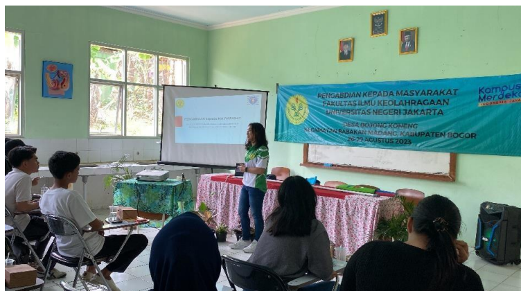
Gambar 2. Penjelasan tentang peralatan dan langkah – langkah pembuatan busur paralon