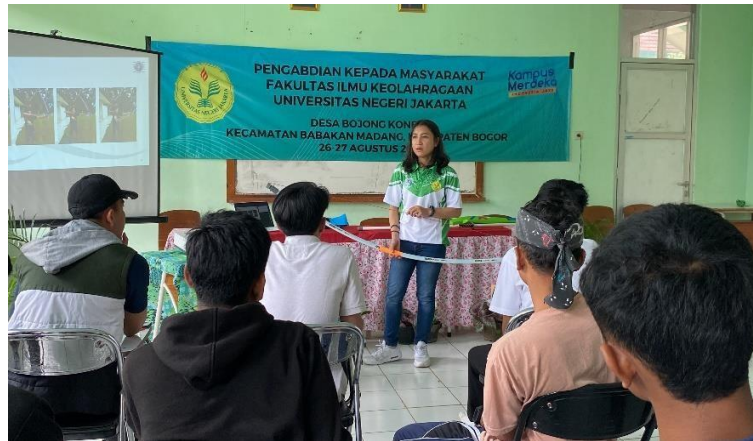
Gambar 4. Praktik membuat busur paralon dan cara menggunakan busur paralon