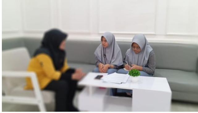
Gambar 11. Wawancara Informan 11 (HT) 31 Juli 2024, pukul: 14.36 WITA Kepala Registrasi Lapas Narkotika Kelas IIA Sungguminasa