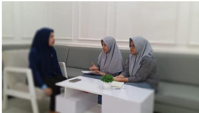
Gambar 10. Wawancara Informan 10 (RA) 31 Juli 2024, pukul: 14.26 WITA