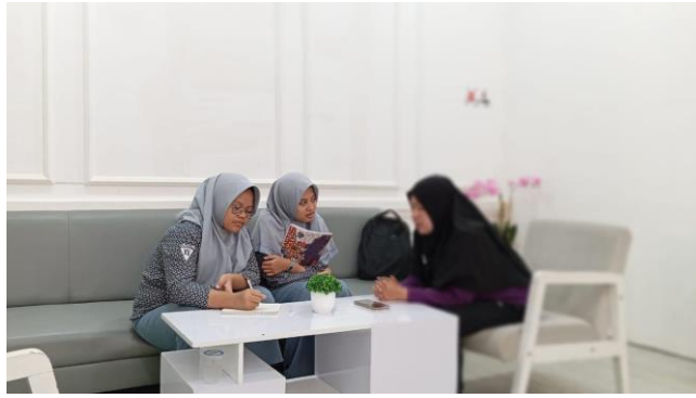
Gambar 7. Wawancara Informan 7 (SA) 31 Juli 2024, pukul: 14.00 WITA