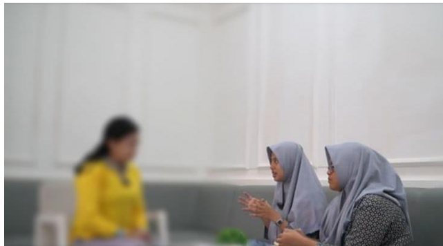
Gambar 12. Wawancara Informan 12 (JI) 31 Juli 2024, pukul: 14.48 Kepala Subseksi Lapas Perempuan Kelas IIA Sungguminasa