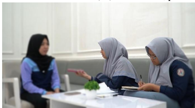
Gambar 5. Wawancara Informan 5 (TI) 29 Juli 2024, pukul: 15.12 WITA