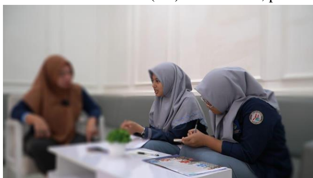
Gambar 4. Wawancara Informan 4 (JL) 29 Juli 2024, pukul: 15.00 WITA