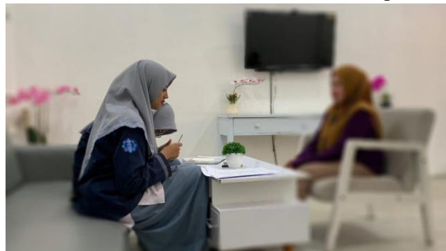
Gambar 2. Wawancara Informan 2 (MI) 29 Juli 2024, pukul: 14.38 WITA