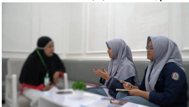
Gambar 6. Wawancara Informan 6 (DI) 29 Juli 2024, pukul: 15.27 WITA