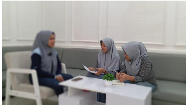
Gambar 9. Wawancara Informan 9 (RI) 31 Juli 2024, pukul: 14.12 WITA