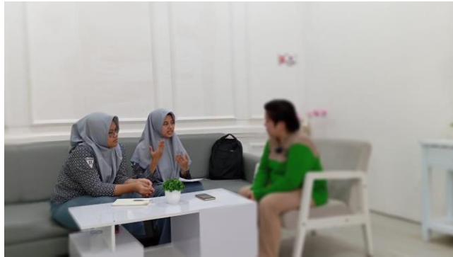
Gambar 8. Wawancara Informan 8 (OM) 31 Juli 2024, pukul: 14.10 WITA