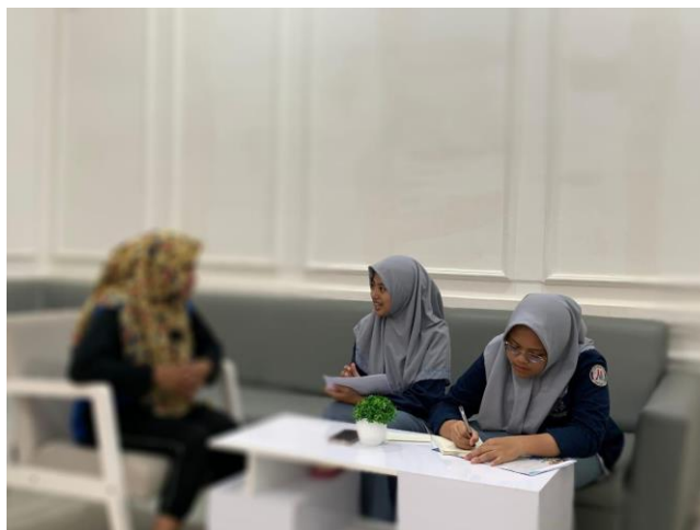
Gambar 3. Wawancara Informan 3 (AS) 29 Juli 2024, pukul: 14.48 WITA