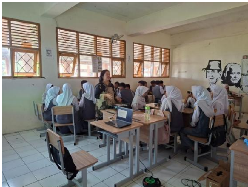
Gambar 3. Suasana di kelas