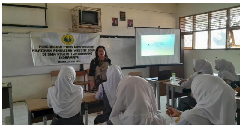
Gambar 1. Suasana kelas dalam proses pembelajaran