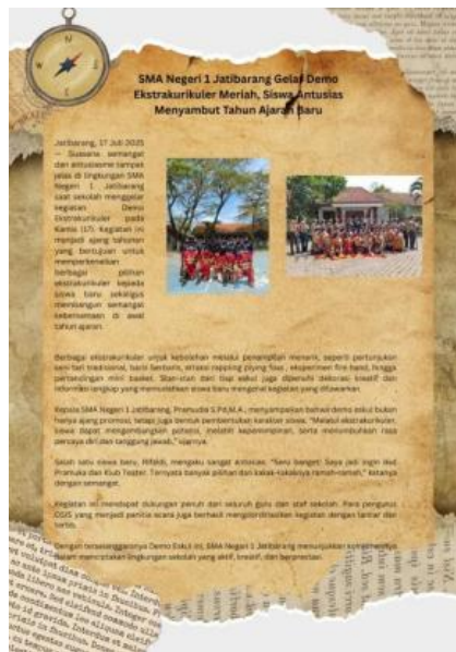
Gambar 7. Hasil karya para siswa SMAN 1 Jatibarang