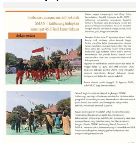
Gambar 8. Hasil karya para siswa SMAN 1 Jatibarang