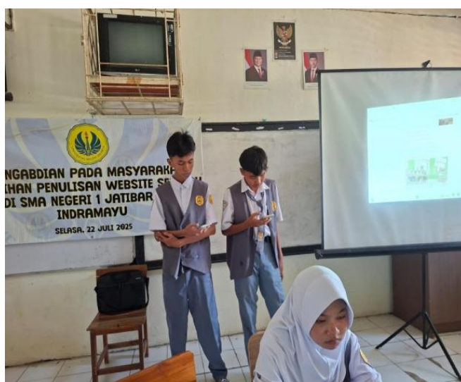
Gambar 4,5 dan 6. Suasana di kelas dan presentasi dari Siswa